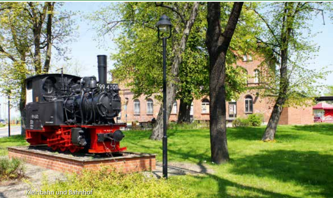
Kleinbahn und Bahnhof

Die Burganlage Wasserburg gliedert sich in Oberburg mit Bergfried und Unterburg und ist umgeben von Wassergräben. 1578/79 wurde sie zu einem Jagdschloss der sächsischen Herzöge umgebaut. Seit 1853 nutzten die Preußen die Wasserburg als Haftanstalt. In der seit 1990 rekonstruierten Wasserburg entstand eine Gaststätte mit Hofbrauerei und Hotelanlage. Links auf dem Gelände, im Torturm, befindet sich das Standesamt.