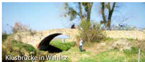
Klusbrücke in Wahlitz

Martin-Schwantes-Straße 37 • 39245 Gommern Tel. (0392 00) 5 14 71 • Fax (0392 00) 5 33 63 E-Mail: steinmetz@kahlo.de