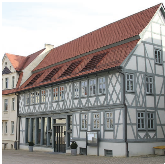
Stadt Haldensleben – Bürgerbüro