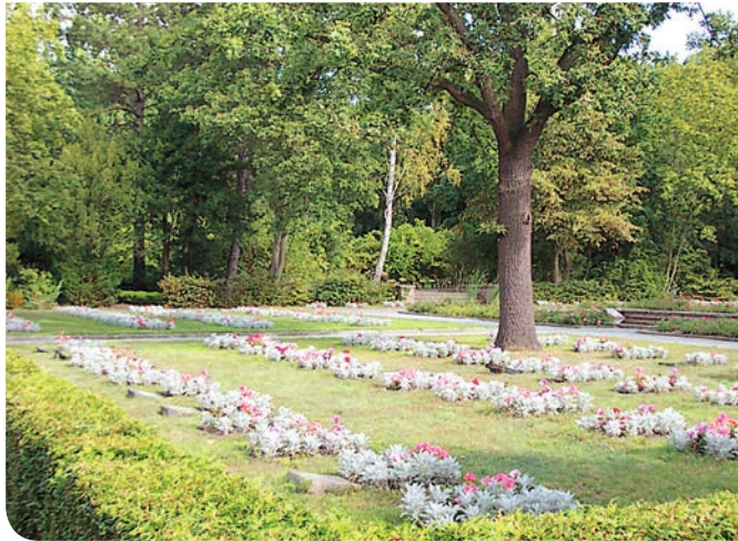
Städtischer Friedhof Haldensleben – Soldatengräber

Die Grundlage für alle Angelegenheiten in Bezug auf das Friedhofswesen ist die Friedhofssatzung der Stadt Haldensleben. Für die Benutzung des Friedhofs sowie seiner Einrichtungen und Anlagen gilt die entsprechende Gebührensatzung.