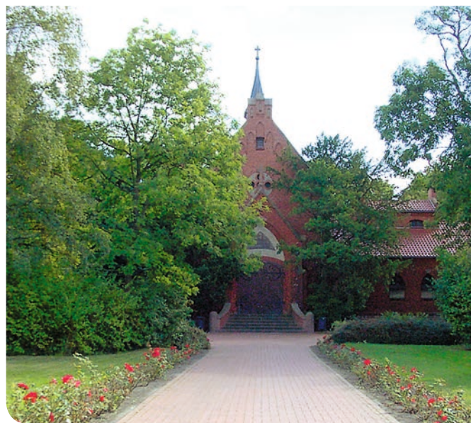
Städtischer Friedhof Haldensleben – Kapelle

des unter Punkt 4 genannten Friedhofes: Ev. – Luth. Pfarrverband Calvörde – Uthmöden Gemeinde Uthmöden An der Kirche 1, 39359 Calvörde