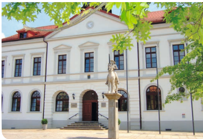
Stadt Haldensleben – Rathaus