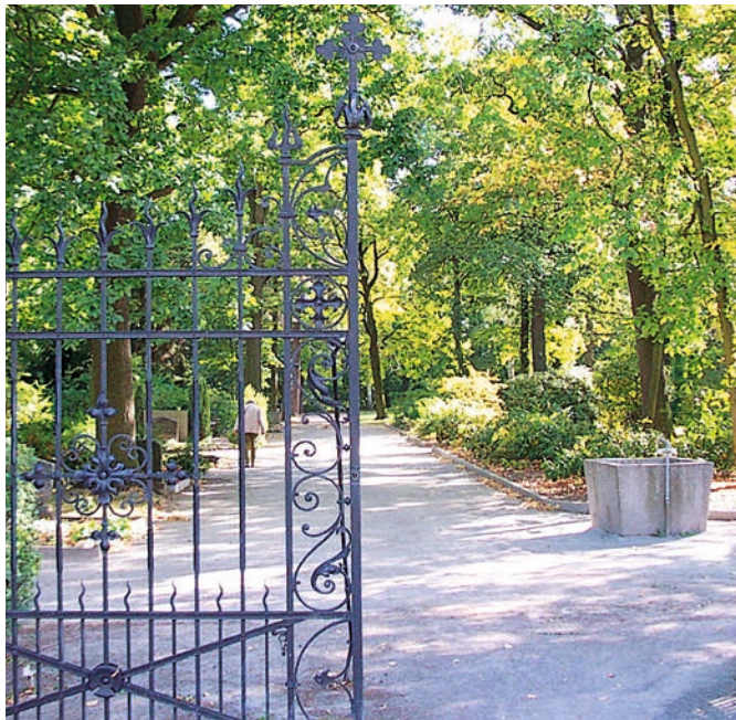
Städtischer Friedhof Haldensleben – Nebeneingang