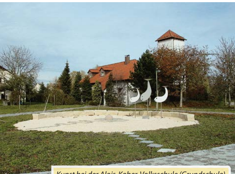
Kunst bei der Alois-Kober-Volksschule (Grundschule)