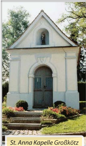
St. Anna Kapelle Großkötz