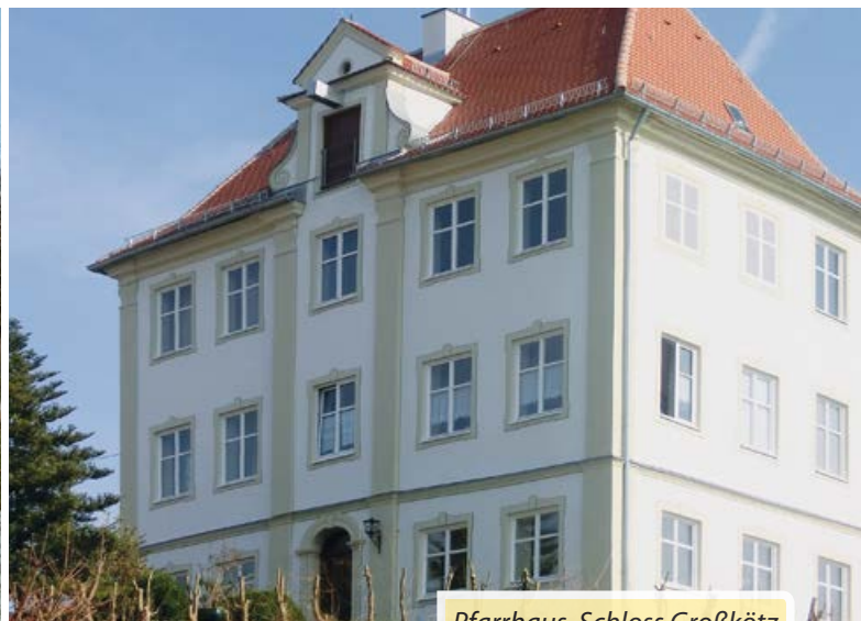
Pfarrhaus, Schloss Großkötz