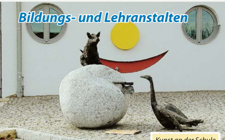
Kunst an der Schule