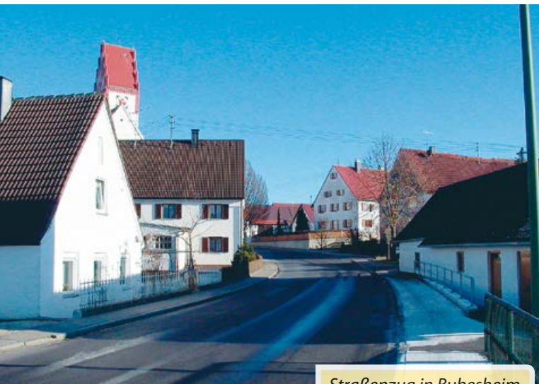
Straßenzug in Bubesheim