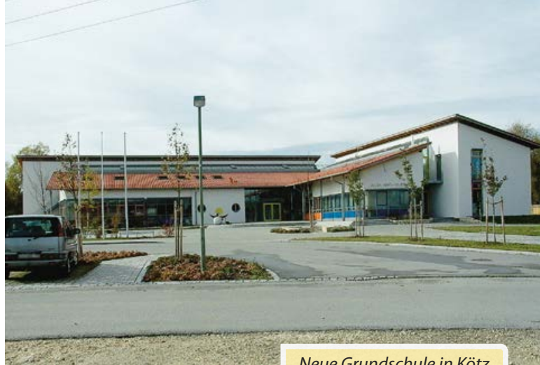
Neue Grundschule in Kötz