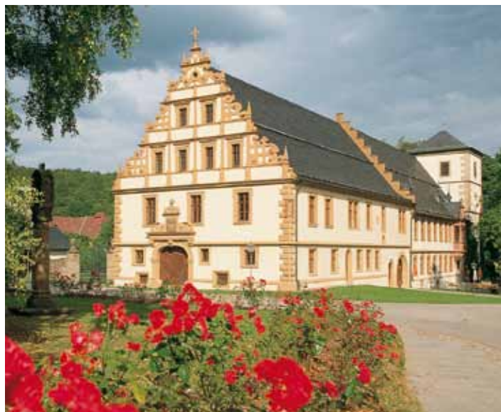
Abtei Maria Bildhausen

Seit 1814 ist Münnerstadt bayerisch. 1972 wurden 10 Dörfer der Umgebung eingemeindet. Die mächtige Abtei in Maria Bildhausen, der Grabfelddom mit den Bildern von Peter Herrlein in Großwenkheim gehören heute ebenso zu Münnerstadt wie die Volkssänger und Tanzgruppen in Reichenbach. Geblieben aus der reichen Geschichte sind weltberühmte Kunstschätze und beeindruckende Bauwerke. Fachwerkhäuser, Tore, Türme – ein Gang durch Münnerstadt ist ein faszinierender Ausflug in die Geschichte.