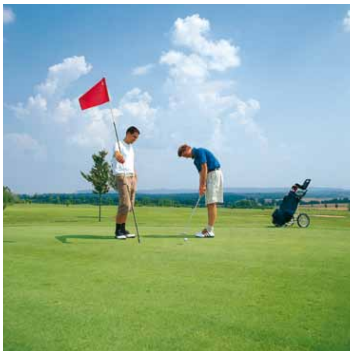
Golfen in Maria Bildhausen

Fest etabliert haben sich Veranstaltungen wie: BraveheartBattle (Extremlauf), Stadtfest „Musik und Märkte“, Ostereiermarkt, Heimatspiel, Oldtimertreffen, Federweißer-Abend und der historische Weihnachtsmarkt.