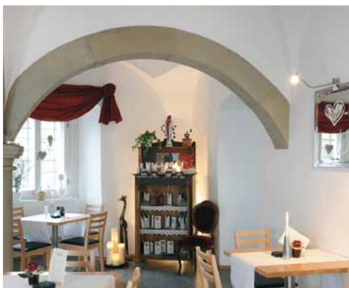
Das Café KOMTUREI im Deutschordensschloss Münnerstadt