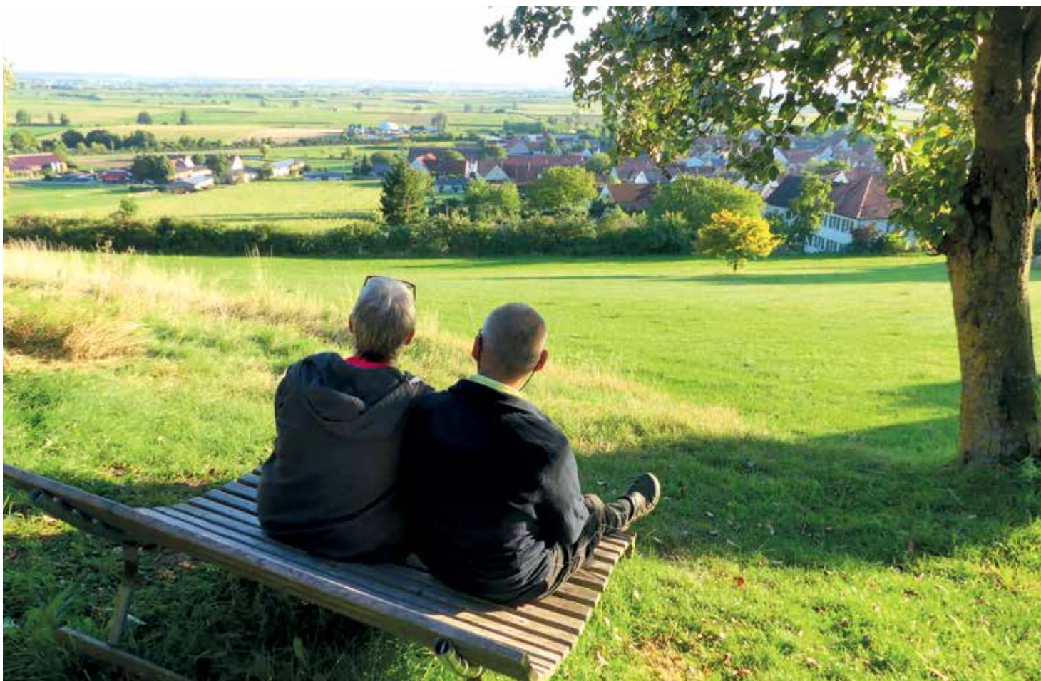
Herrlicher Ausblick ins Ries vom Ehinger „Riesblick“ an der Simultankirche