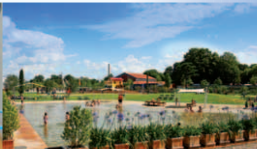
Spielanlage im Schlosspark