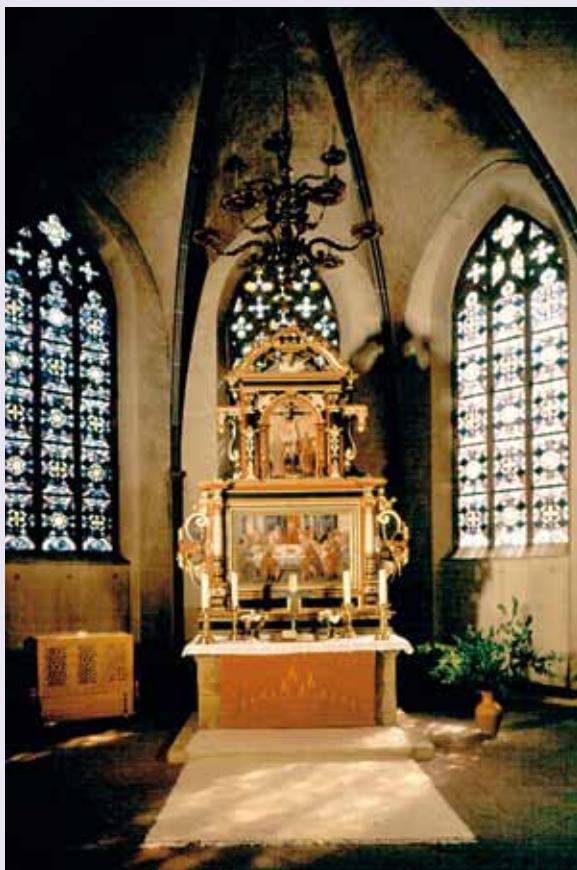
Altar der St. Nikolaikirche

Heiraten hat Konjunktur und Tradition und Romantik stehen wieder hoch im Kurs. Polterabend, Brautentführung, Strumpfbandwerfen und Blümchenstreuende Kinder erleben eine Renaissance – viele Bräute wünschen sich ein Fest wie das ihrer Großeltern, am liebsten noch schöner und größer – romantisch und perfekt!