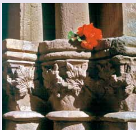
Kapitelle mit Blumenstrauß an der St. Nikolaikirche