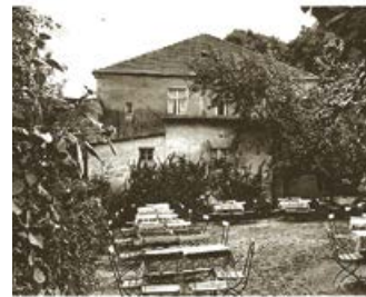
Historische Aufnahme der Gaststätte „Drei Linden“ in Seddin um 1915