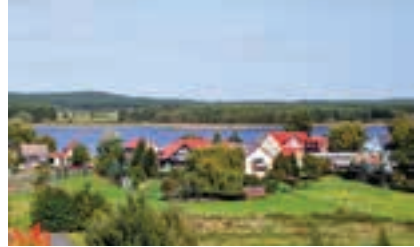
Dorfansicht in Seddin

Seddiner See Apotheke Kunersdorfer Str. 12 OT Neuseddin 14554 Seddiner See Tel.: 033205 54238 Tel.: 033205 54239