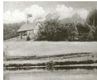
Die Kähnsdorfer Hütte in Kähnsdorf um 1915, brannte später ab