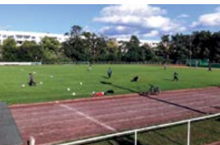
Sportplatz in Neuseddin, Kunersdorfer Straße, Zufahrt über Schmiedestraße

Kontakt: E-Mail: info@esv-lok-seddin.de , Internet: www.esv-lok-seddin.de