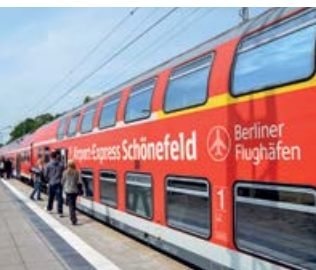
Zugverkehr am Bahnhof „Seddin“ im Ortsteil Neuseddin