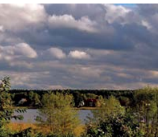
Blick auf Kähnsdorf