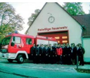
Kameraden der Feuerwehr vor dem Feuer- wehrgebäude in Seddin, Hauptstraße