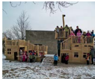
Außengelände der Kita „Seepferdchen“ in Seddin