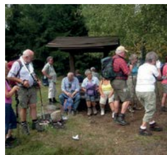
Wanderer des ESV bei ihren Wanderausflügen