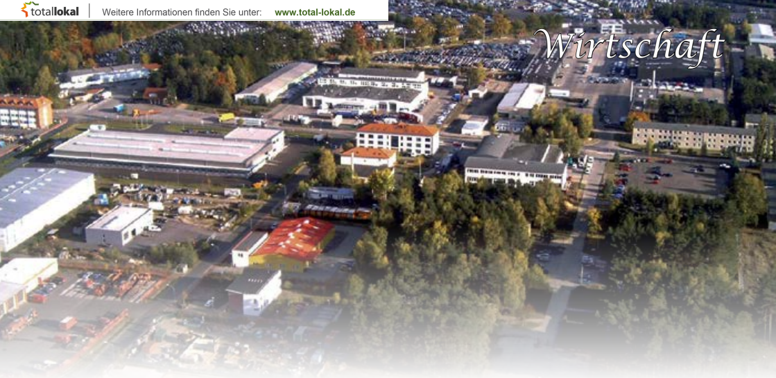
Das Gewerbegebiet in Neuseddin

In der Gemeinde Seddiner See gibt es 297 Unternehmen. Diese verteilen sich auf die Ortsteile wie folgt: