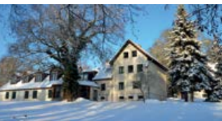
Ländliche Heimvolkshochschule am Seddiner See e.V.