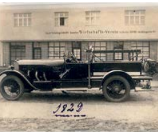
Feuerwehrfahrzeug von 1929 der Feuerwehr in Neuseddin, hier in der Thielenstraße