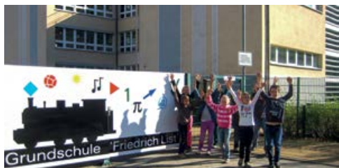
Friedrich-List-Grundschule in Neuseddin