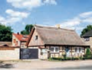
Dorfansichten in Seddin