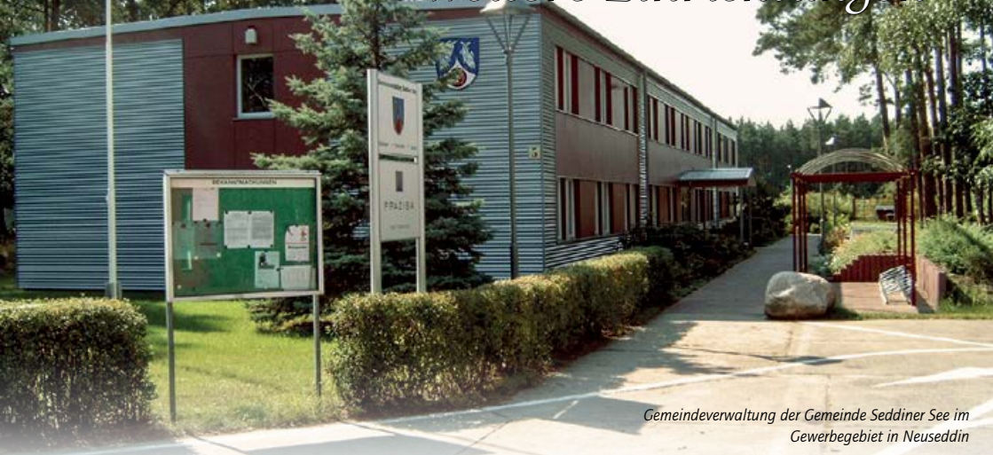
Gemeindeverwaltung der Gemeinde Seddiner See im Gewerbegebiet in Neuseddin