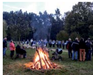
Aktionstag „Feuer und Flamme für unsere Museen“