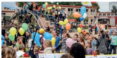
Fest zum 40-jährigen Jubiläum