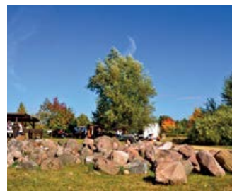
Findlingsgarten am Seddiner See e.V.

Jeden Mittwoch ab 19.00 Uhr treffen sich die Kameradinnen und Kameraden zum Ausbildungs- und Gerätedienst in den Feuerwehrgerätehäusern. Hier wird der Grundstein für den schweren Einsatzalltag gelegt. Wer Lust hat, sich den Aufgaben der Feuerwehrfrau/ mann zu stellen, ist hier gern willkommen.