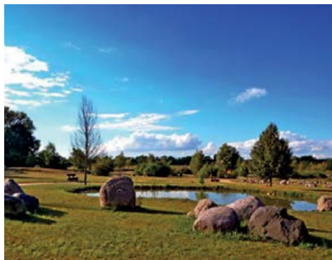
Findlingsgarten am Seddiner See