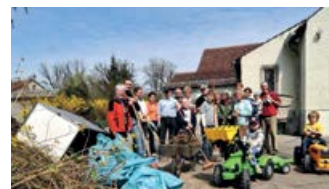
Aufräumen am ehemaligen REWE-Markt