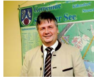
Bürgermeister Axel Zinke