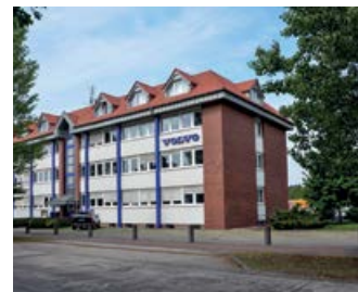
Gewerbebetriebe im Gewerbegebiet Neuseddin