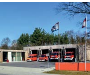
Feuerwehrgebäude in Neuseddin, Kuners- dorfer Straße