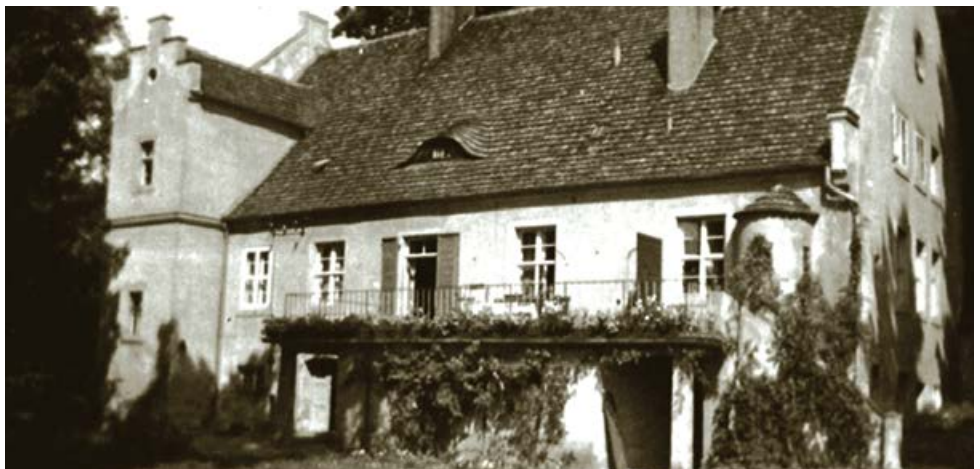
Historische Aufnahme der Oberförsterei Kunersdorf „Forsthaus“ um 1915, heute befindet sich hier in umgestalteten Räumlichkeiten die Heimvolkshochschule am Seddiner See e.V.