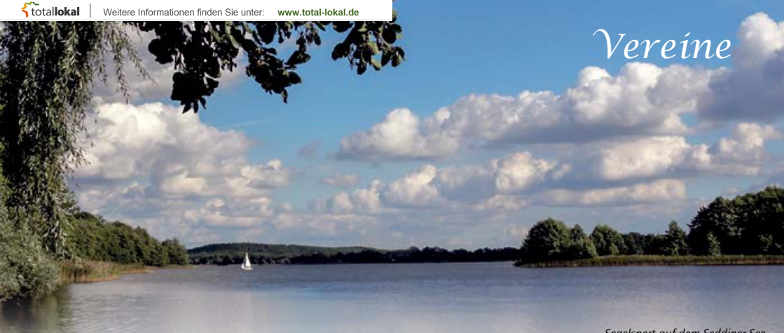
Segelsport auf dem Seddiner See