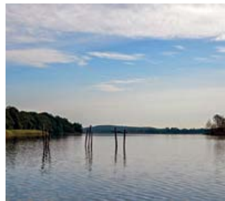
Reusen im See

Der Kähnsdorfer See , der auf älteren Karten als Kleiner Seddiner See bezeichnet wird, ist von Schilf und Erlenbruchwäldern umgeben.