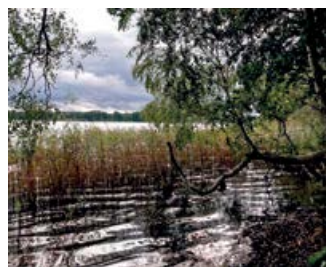
Uferlandschaft am Seddiner See