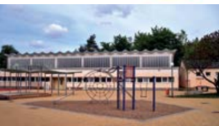
Turn- und Ringerhalle auf dem Schulhof in Neuseddin

Der Ring- und Sportverein (RSV) Neuseddin e.V. ist ein in der Gemeinde Seddiner See ansässiger Verein, der im Juni 1990 gegründet worden ist. Wir bieten unter fach- und sachkundiger Anleitung erfahrener und geschulter Trainer und Übungsleiter in den Sektionen Ringen und Breitensport aktive sportliche Betätigung für alle Altersgruppen an. Unsere wichtigste Aufgabe sehen wir darin, besonders Kindern und Jugendlichen eine sinnvolle Freizeitbeschäftigung zu bieten; sie werden in der Sportart Ringen leistungsorientiert gefördert. Trainingsort ist die Ringerhalle auf dem Gelände der Grundschule