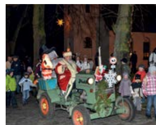
Adventsfest in Seddin am Kirchplatz mit Seddiner Weihnachtsmann