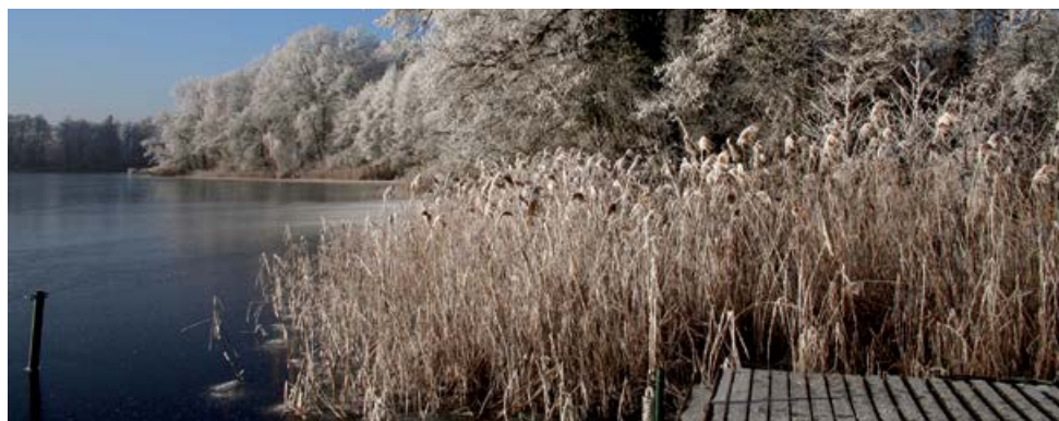
Uferlandschaft am Seddiner See