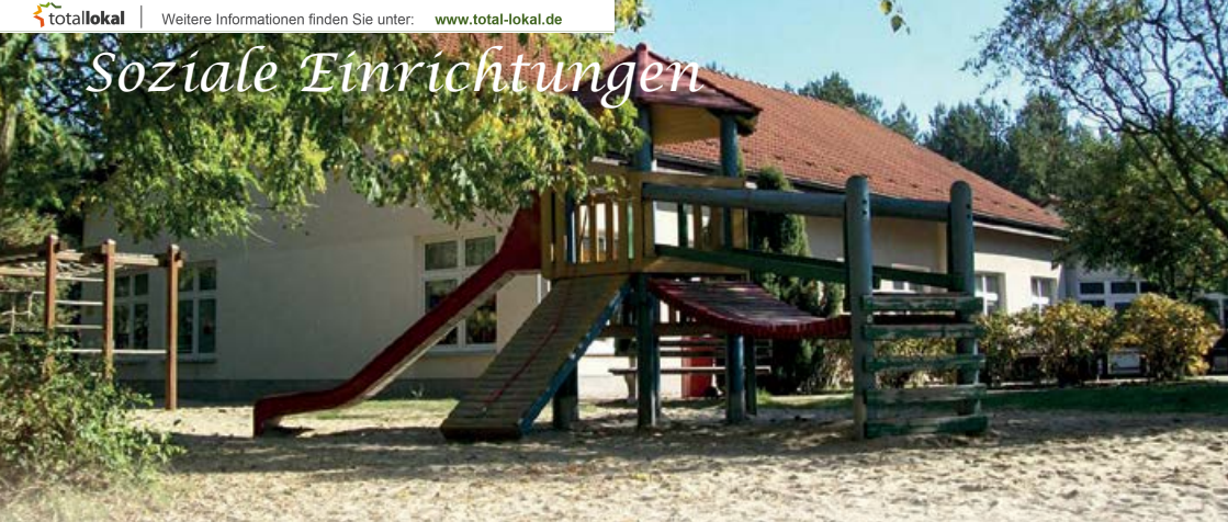
Spielplatz der Kita „Waldsternchen“ in Neuseddin