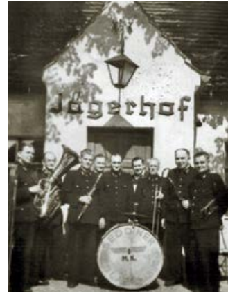
Historische Aufnahme einer Blasmusikkapelle vor der Gaststätte „Jägerhof“ in Seddin um 1915

Für Kähnsdorf und Seddin beginnt in den 60er und 70er Jahren wieder eine verstärkte touristische Erschließung. 1972 wurden die Seddiner Seen zum Naherholungsgebiet erklärt. Es entstanden Ferienunterkünfte von Betrieben und private Wochenendhäuser. In den Sommermonaten