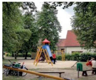
Spielplatz vor der „Kita Seepferdchen“