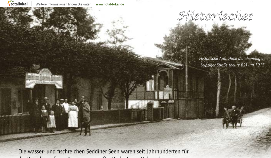
Historische Aufnahme der ehemaligen Leipziger Straße (heute B2) um 1915

Die wasser- und fischreichen Seddiner Seen waren seit Jahrhunderten für die Bewohner dieser Region von großer Bedeutung. Neben den geringen Ernten, die die Landwirtschaft auf den kargen Böden zuließ, trugen sie entscheidend zum Lebensunterhalt der Menschen bei.