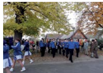
Spielmannszug Neuseddin e.V.

Dr.-Albert-Schweitzer-Str. 12, 14554 Seddiner See