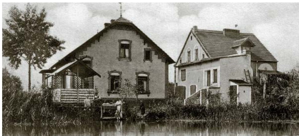
Historische Postkarte vom „Landhaus Pirat“, später „Wiesengrund“ am Kleinen Seddiner See in Seddin um 1920, heute Wohnhaus in der Bahnhofstraße in Seddin

Mit der Kommunalwahl im Dezember 1993 erfolgte die praktische Umsetzung des Beschlusses. Es entstand eine neue Gemeinde, die den Namen