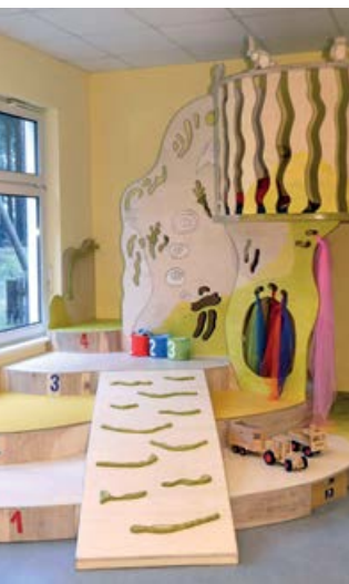
Spielpodest im Krippenbereich der Kita „Waldsternchen“ in Neuseddin

Im Ortsteil Neuseddin liegt unsere Kindertagesstätte „Waldsternchen“ mit einer Kapazität von ca. 150 Kindern im Alter von 0 Jahren bis zum Schuleintritt. Die Kita befindet sich in unmittelbarer Nähe des Waldes und verfügt über ein sternförmig aufgebautes Gebäude mit einem weitläufigen Außengelände. Einerseits geht es in unserer Kita um die allseitige Förderung und Bildung der Kinder von Anfang an, andererseits um die Stärkung der Erziehungspartnerschaft zwischen Eltern, Erziehern und Erzieherinnen im Alltag. Die Kita stellt sich in ihrer Konzeption und Arbeitsweise den neuen Herausforderungen und Bedarfslagen von Familien und Kindern.