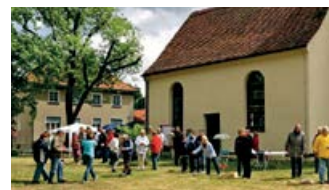
Boulturnier am Kirchplatz