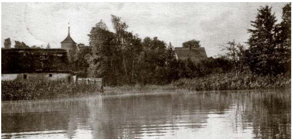
Ehemalige Pferdetränke am Seddiner See in der Nähe des Kirchplatzes in Seddin um 1915