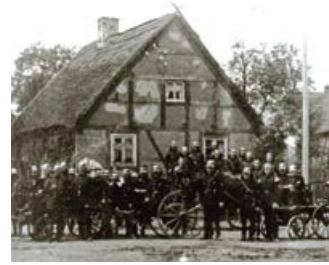
Feuerwehr Seddin am Kirchplatz in Seddin um 1924; das Haus im Hintergrund brannte in späteren Jahren ab

„Ich bin durch die Mark gezogen und habe sie reicher gefunden, als ich zu hoffen wagte“.