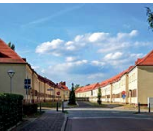
Dr.-Stapff-Straße in Neuseddin

Äußere Erschließung des Gewerbegebietes: vorhanden