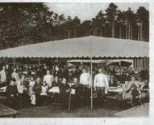
Historische Postkarten vom Bahnhof „Seddin“ in Neuseddin