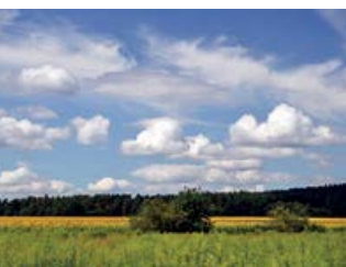
Wiesen bei Kähnsdorf