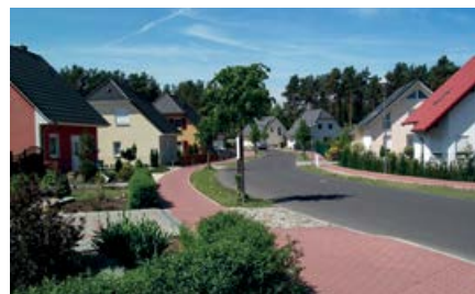
Neu entstandene Eigenheime im Lindenring in Neuseddin

Anschrift: Gemeindeverwaltung Seddiner See Neuseddin, Kiefernweg 5, 14554 Seddiner See Tel.: 033205 5360 Telefax: 033205 53627 E-Mail: info@seddiner-see.de Internet: www.seddiner-see.de