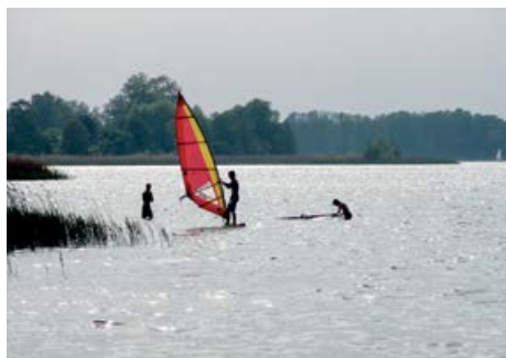
Strände am Seddiner See