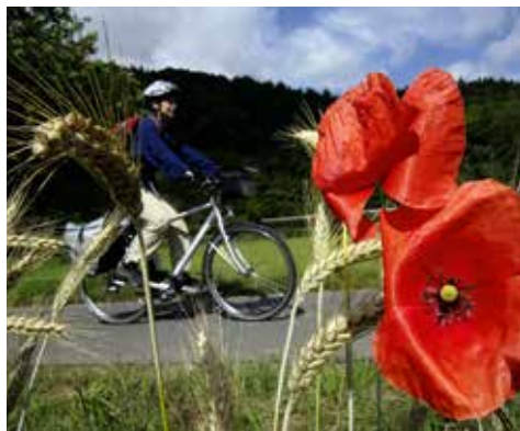
Radtour auf dem Werratal-Radweg

Der Werratal-Radweg führt über 300 km durch die romantische wie abwechslungsreiche