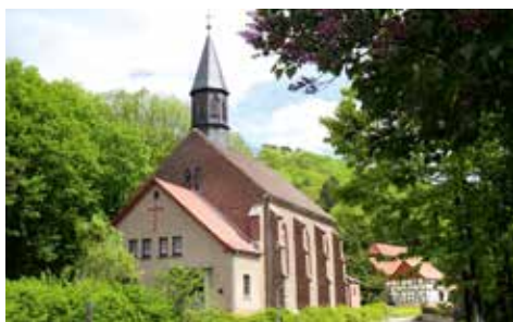
Katholische Kirche St. Marien Treffurt