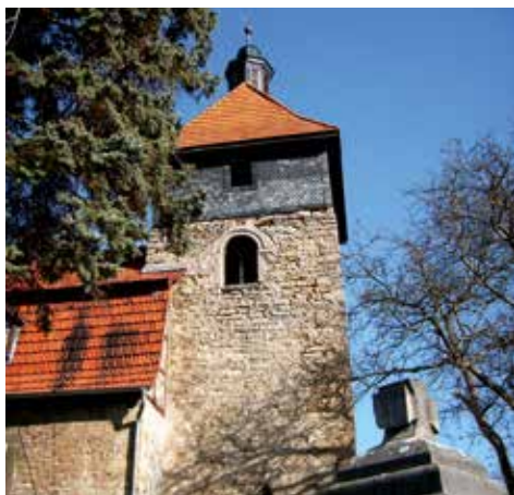
St. Michael Schnellmannshausen