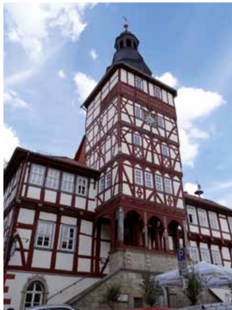
Rathaus in Treffurt

Geologisch und botanisch ist die Region vor allem vom Muschelkalk geprägt, der viele geschützte Arten wie verschiedene Frühblüher, Orchideen und die Kuhschelle hervorbringt.