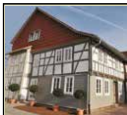
Fachwerk Musterhaus Wanfried