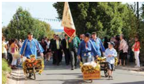
Kirmes in Großburschla