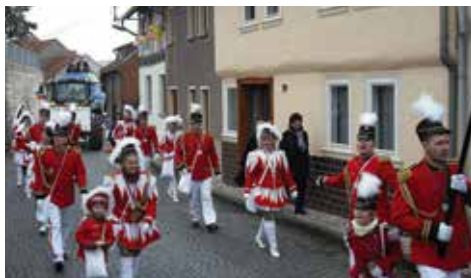
Karnevalsanzug in Treffurt

Treffurt, Falken und Großburschla verfügen über sehr sehenswerte, ehrenamtlich geführte Heimatmuseen mit verschiedenen thematischen Ausstellungen.