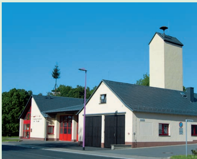
Freiwillige Feuerwehr Triebel

Die Gemeinde unterhält in 4 Orten jeweils ein Bürgerhaus und eine Ortsfeuerwehr sowie einen Jugendklub. Außerdem agieren viele Vereine, die sich ehrenamtlich für ein reges gesellschaftliches, kulturelles, sportliches und öffentlichkeitswirksames Leben in allen Orten der Gemeinde einsetzen.