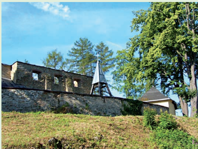
Kirchenruine Triebel mit Glockenträger

Glas Triebel, Posseck, Sachsgrün, Wiedersberg Papier Sachsgrün Elektronikschrott Triebel und Sachsgrün Altkleider Triebel, Posseck, Wiedersberg (Einzelheiten entnehmen Sie bitte dem jährlichen Abfallwegweiser)