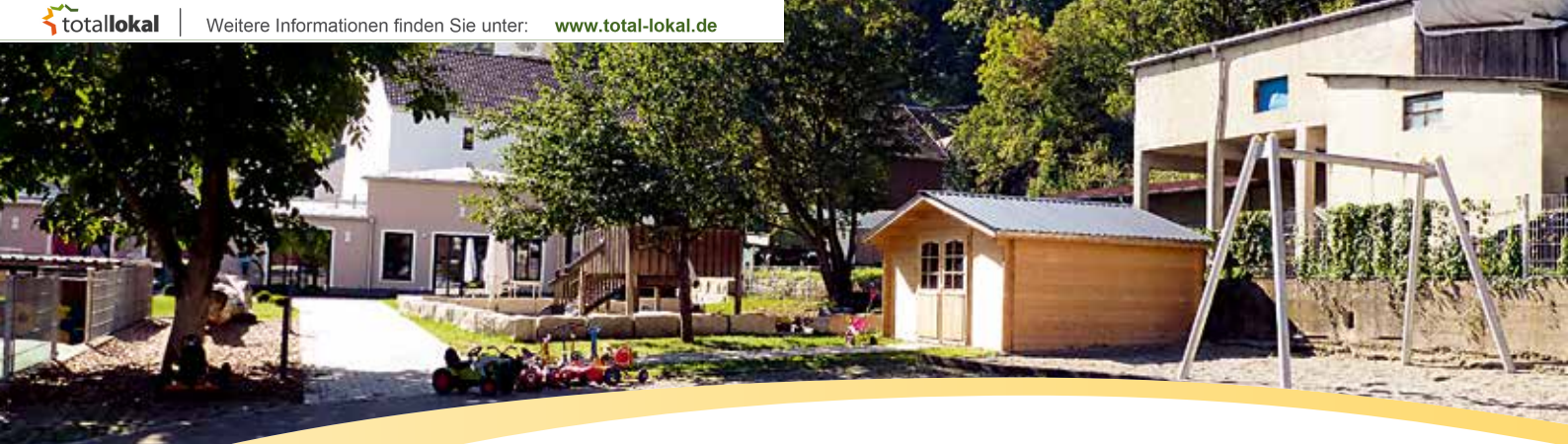
Kindergarten St. Andreas