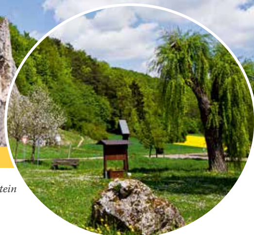
Dohlenfelsen in Konstein