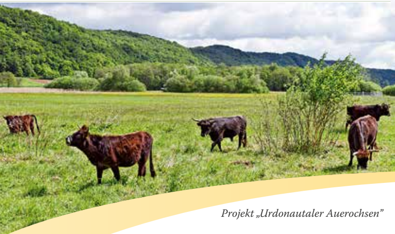
Projekt „Urdonautaler Auerochsen“