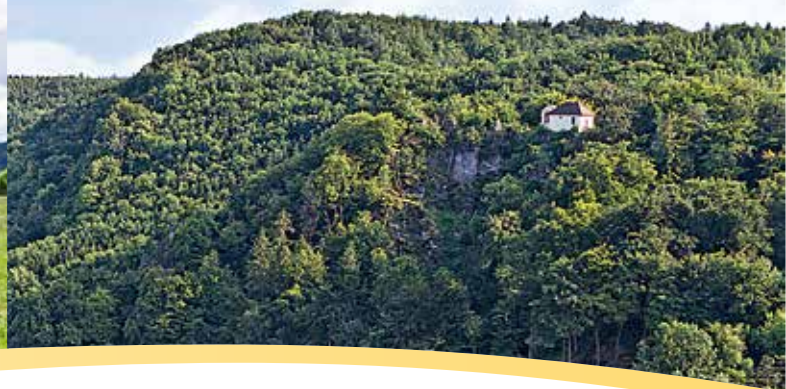
Kapelle auf dem Kreuzberg