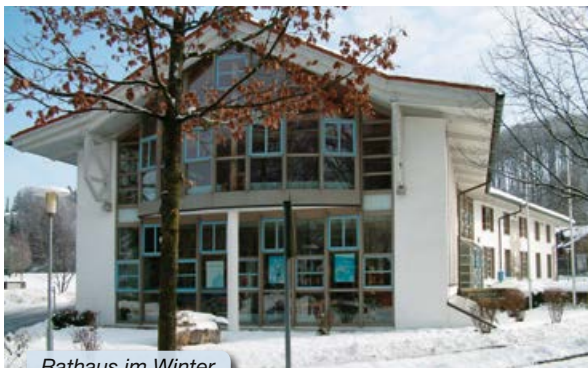
Rathaus im Winter

Weitere Informationen finden Sie auf unserer Internet-Seite