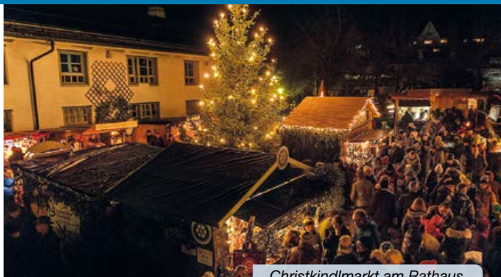
Christkindlmarkt am Rathaus