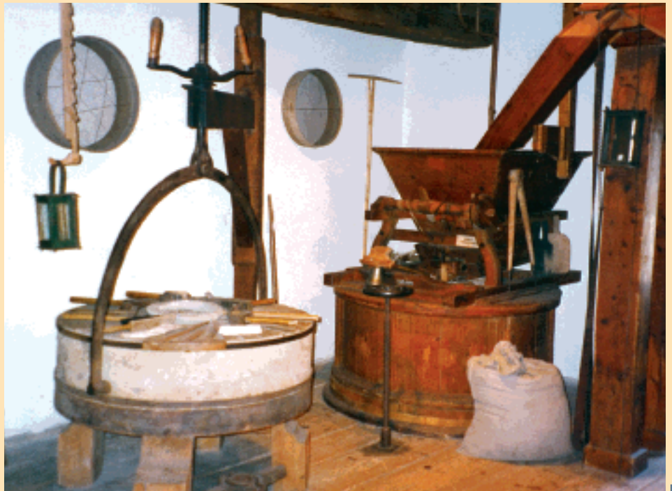
Foto: Volkskunde- u. Mühlenmuseum, Mahlraum

Das Museum im Ortsteil Waltersdorf befindet sich in der ältesten Wassermühle des Ortes. Noch heute ist der gut erhaltene Mahlraum mit Steinmahlgang und Walzenstuhl zu sehen. Im Raum der Ortsgeschichte kann man die Entwicklung vom Bauern- zum Weberort und vom Industrie- zum Erholungsort erleben. Zu den weiteren Sehenswürdigkeiten des Museums gehören das zu Ehren des 1786 in Waltersdorf geborenen Komponisten, Friedrich Schneider, eingerichtete Biedermeierzimmer, eine Bauernstube mit Möbeln um 1800, eine Schlafkammer mit Herrnhuter Möbeln sowie eine Weberstube mit funktionstüchtigem Handwebstuhl. In den Räumlichkeiten des Museums werden Lichtbildervorträge gehalten, Bastelnachmittage durchgeführt und Mühlenmärchen gelesen. Großen Zuspruch erfährt das Museum auch zum Tag des offenen Denkmals.