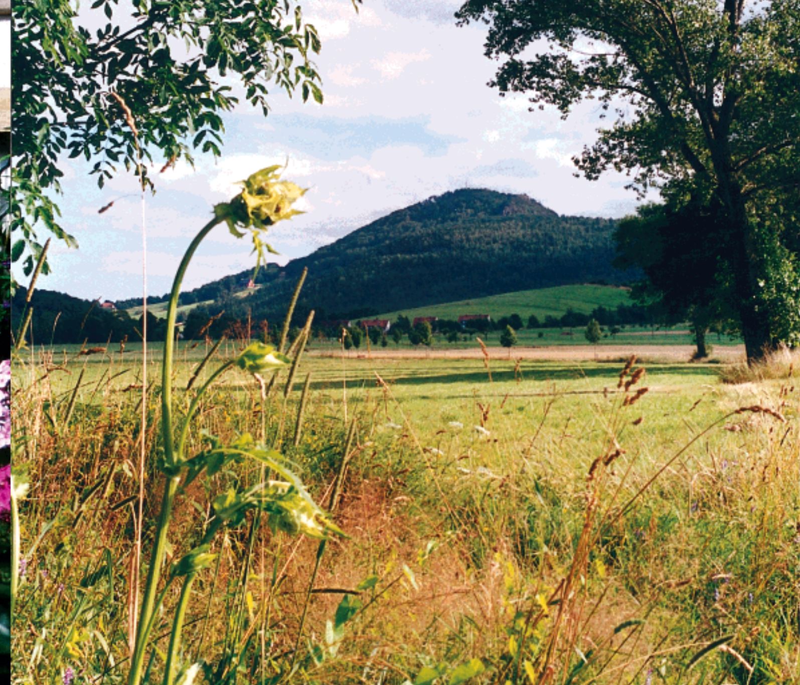
Blick zur Lausche