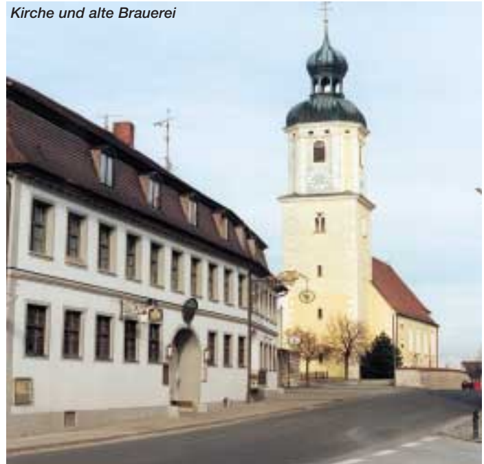
Kirche und alte Brauerei

Die Sitzverteilung im Gemeinderat von 1996 bis 2002: UW 8, CSU 6, SPD 4, FW 1, AJ 1.