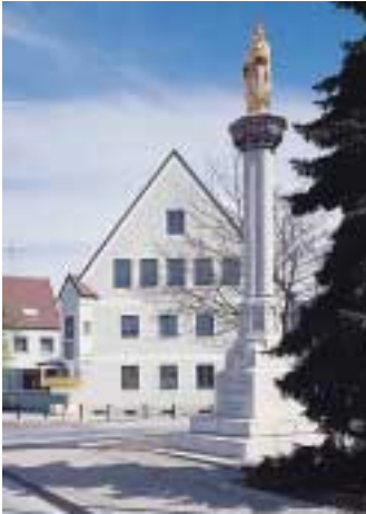
Rathaus mit Mariensäule