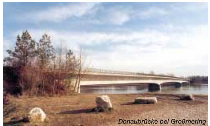
Donaubrücke bei Großmehring