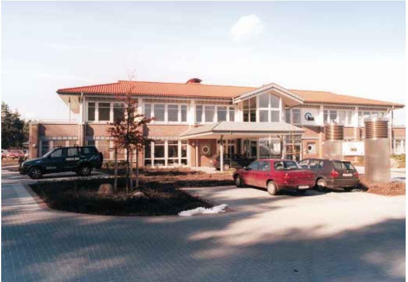
Überregionales Schulungszentrum der IKK Brandenburg und Berlin und Regionaldirektion Cottbus in Kolkwitz

Der Standort Kolkwitz ist für die Innungskrankenkasse Brandenburg und Berlin nicht nur Sitz einer Regionaldirektion, sondern stellt gleichzeitig im gleichen Hause einen Schulungs- und Weiterbildungsstandort in den neuen Bundesländern dar. In diesem Schulungszentrum werden Mitarbeiterinnen und Mitarbeiter der IKK Brandenburg und Berlin für die ständig steigenden Anforderungen an die Sozialversicherung weiterqualifiziert.