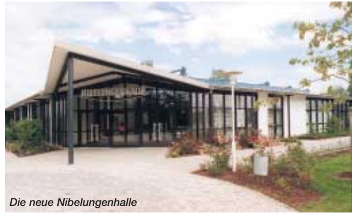
Die neue Nibelungenhalle

erklärungen beide Gemeinden offiziell Partnergemeinden wurden. Nach fünf Jahren kann festgestellt werden, daß sich die Partnerschaft zwischen der Gemeinde Großmehring in Bayern und der Gemeinde Kolkwitz in Brandenburg bewährt hat.