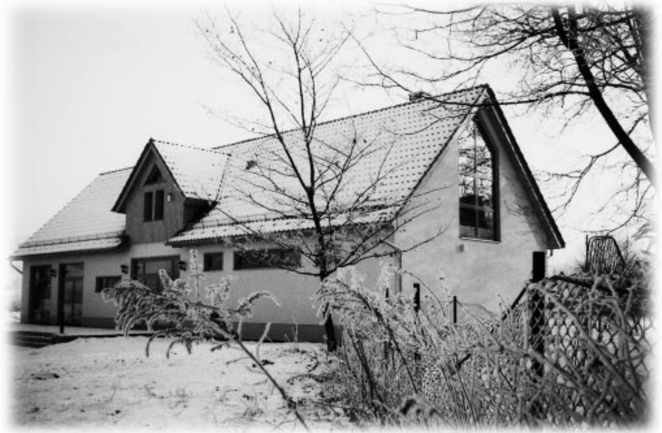
Haus der Jugend und des Sports in Nerchau. Einweihung am 21. Januar 1998