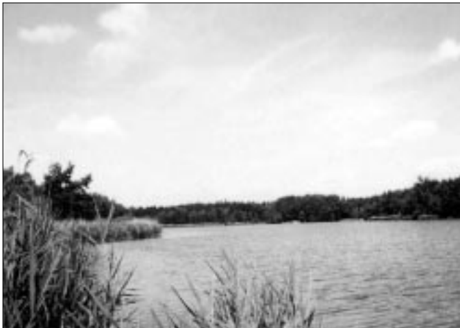
Blick auf den Kirchenteich

Erleben Sie unsere schöne waldreiche Umgebung. Es lohnt sich zu jeder Jahreszeit.