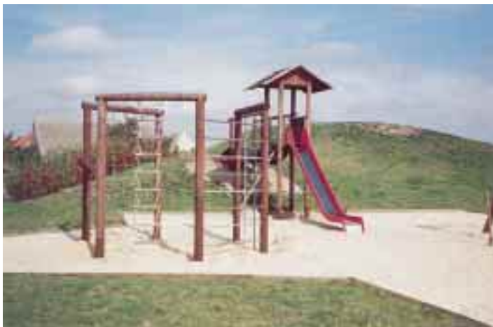
Kinderspielplatz in Schraden