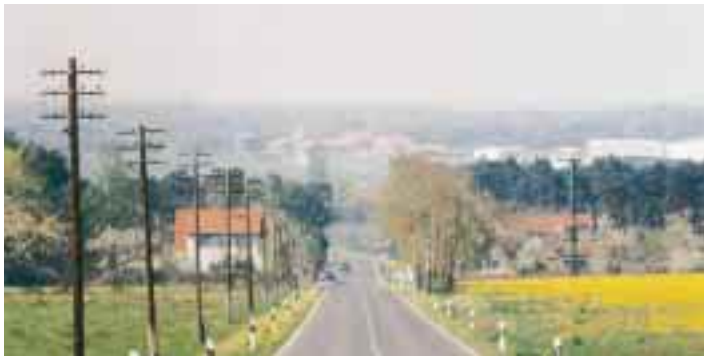
Blick von Döllingen nach Kahla