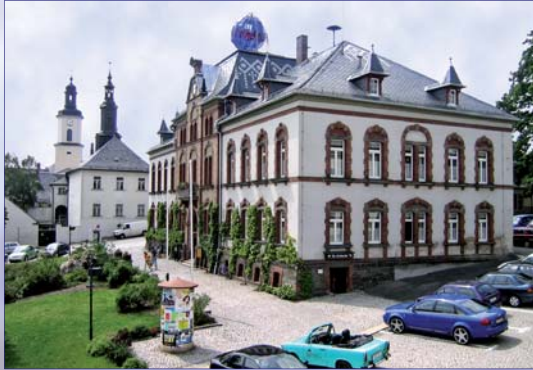
(Rathaus und Amtsgericht im Stadtzentrum)