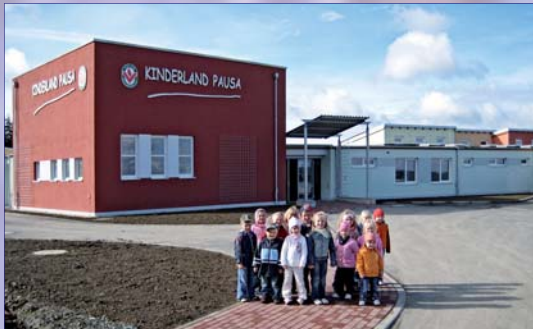
Der Neubau der Kindertagesstätte bietet mit seiner Fertigstellung am 12. Oktober 2007 Platz für die Betreuung von 152 Kindern.