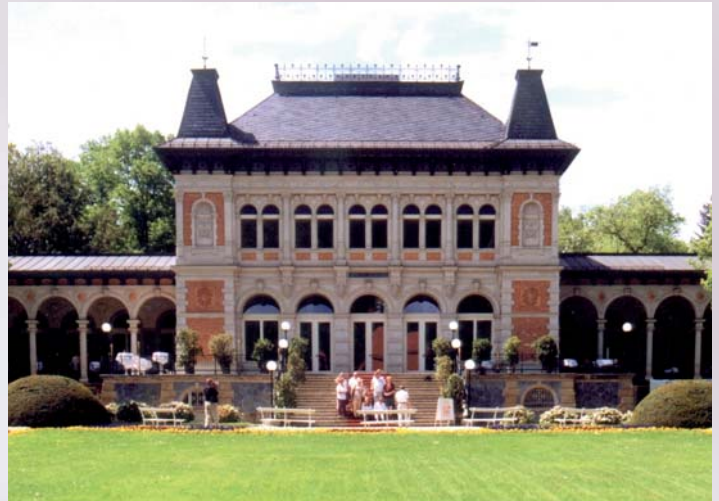
Königliches Kurhaus Bad Elster

Seit Mai 2004 steht im Bereich der Staatsbäder wieder das „König-Albert-Theater als äußerst attraktive Spielstätte zur Verfügung – ausgestattet mit modernster Bühnentechnik. Hinzu kam im Juni 2007 als Open-Air-Gelände das gleichfalls umfassend rekonstruierte idyllische Naturtheater. Gegenwärtig im Ausbau befindet sich das „Sächsische Ba-