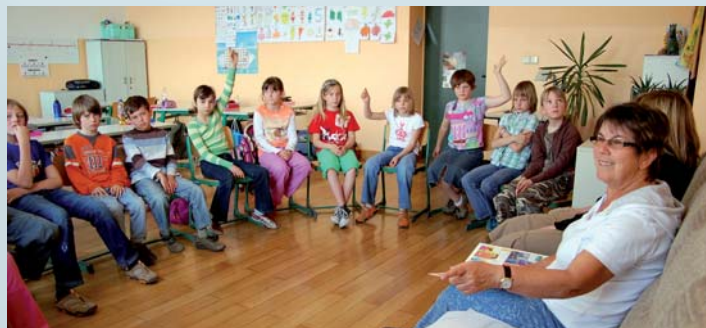
Sexualerziehung durch das Gesundheitsamt in Schulen Foto: Krug