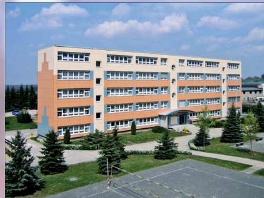
Das modernisierte Schulgebäude beherbergt die Grund- und Mittelschule sowie den Hort und befindet sich in unmittelbarer Nähe zur neuen Kindertagesstätte.

In den Sommermonaten lädt das attraktive Freibad in schöner ruhiger Lage zu Spaß und Erholung ein. Ebenfalls gibt es in der Stadt Pausa ein reges Vereinsleben (ca. 45 Vereine). Dies sind touristische, sportliche und gesellschaftliche, in denen sich auch eine große Anzahl von Kindern und Jugendlichen betätigt. Möglichkeiten der Ferien- und Freizeitgestaltung bietet der Jugendförderverein in seinen Räumen.