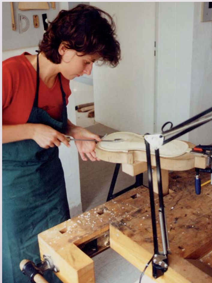
Berufsfachschule im Fach „Geigenbau“