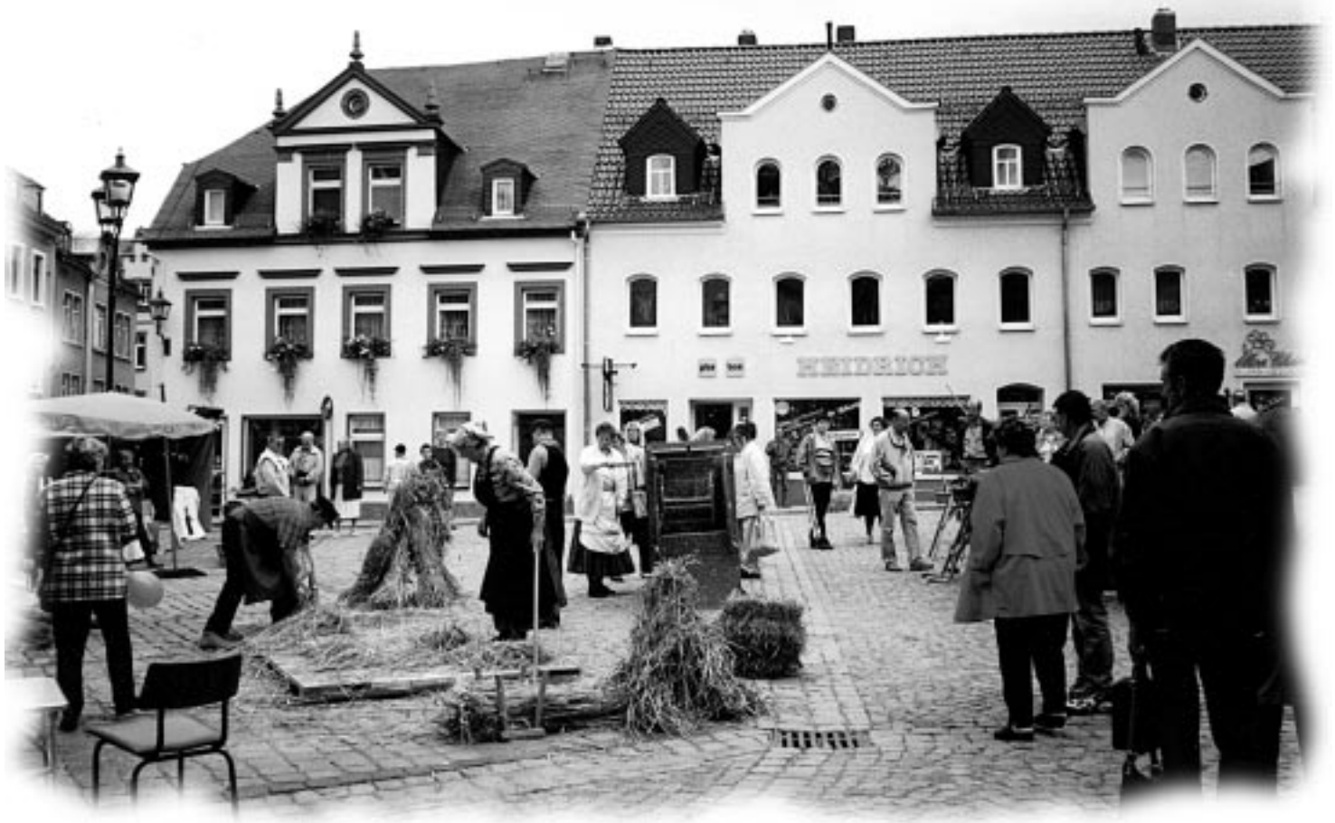
„Historischer Markt“ auf dem Rathausvorplatz