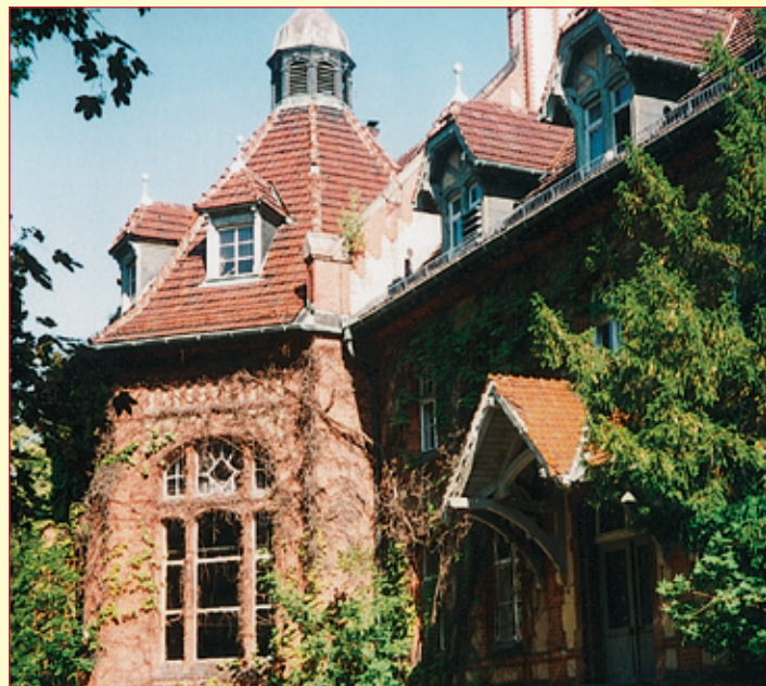
Sehenswertes in Beelitz-Heilstätten