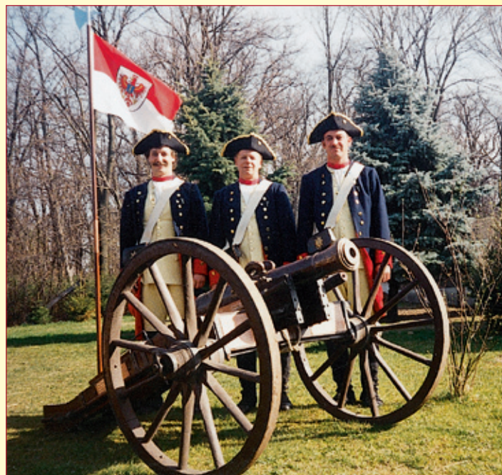
Beelitzer Kanoniere des BCC

Wichtige Quellen zur Geschichte der Ortsteile: Assing, Helmut, Beelitz im Mittelalter, in: Festschrift. 1000 Jahre Beelitz. 997–1997, Mering 1997; ders., 750 Jahre Stadt Beelitz. Zur Bedeutung der mittelalterlichen Stadtgründung, in: Beelitzer Nachrichten, 24.09.1997; Cohrs, Hartmut, Heimatgeschichtliche Texte, im Besitz des Beelitzer Heimatvereins; Handke und Noack, Architektur- und Ingenieurbüro Treuenbrietzen, Denkmalbereichssatzung Altstadt Beelitz, Vorlage, 1997; Ortslexikon für Brandenburg, Teil V, Zauch-Belzig, bearb. v. Peter P. Rohrlach, Weimar 1977; Partenheimer, Lutz, Geschichte der Stadt Beelitz, in: Beelitz. Informationsbroschüre für Bürger, 1997; Städtebuch Brandenburg und Berlin, Stuttgart, Berlin, Köln 2000, S. 26 ff.