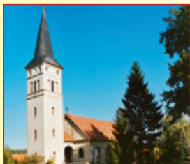
Schinkelkirche in Schäpe

wurde 1370 das erste Mal urkundlich erwähnt. Im Jahr 1998 wurden in der Gemarkung Schlunkendorf Lesefunde gemacht. Sie bezeugen einen germanischen Siedlungsplatz für die Zeit vor etwa 2200 Jahren (Eisenzeit). Eine slawische Ansiedlung (etwa 300 v. u. Z.) dokumentiert ein 1887 gefundener Begräbnisplatz mit etwa 40 Urnen. Um den Ort herum wird großflächiger Spargelanbau betrieben. Der Verein „Beelitzer Spargel“ hat hier seinen Sitz. In einem rekonstruierten, in traditioneller Lehmbauweise errichteten Bauernhaus wurde das erste Spargelmuseum im norddeutschen Raum eingerichtet. Es vermittelt interessante