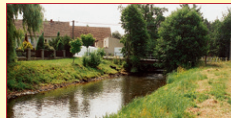
Blick auf Nieplitz bei Salzbrunn