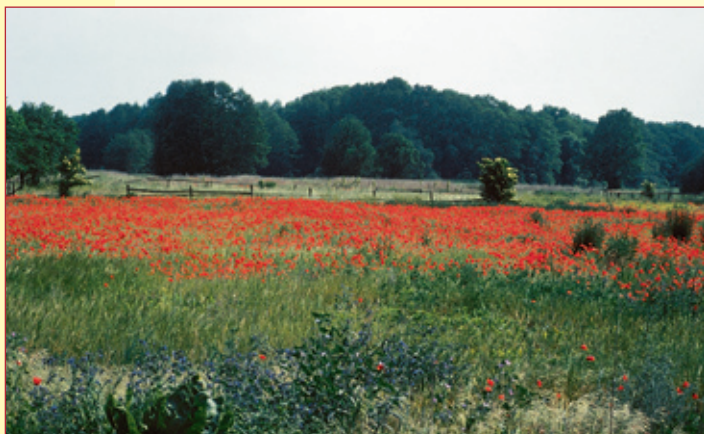
Landschaftsoberfläche Impressionen um Beelitz

Sehen sich die Besucher im Zentrum des Städtchens um, fällt die innere Altstadt mit ihrem mittelalterlichen Grundriss auf. Sie ist ein Flächen- und Denkmal, und Beelitz ist Mitglied der Arbeitsgemeinschaft „Städte mit historischen Stadtkernen“ des Landes Brandenburg. Einige Gebäude sind zusätzlich als Einzeldenkmale ausgewiesen: Die alte Posthalterei, ein zweigeschossiger Putzbau von fünf Achsen, wurde 1789 vom damaligen Bürgermeister und Postmeister Gottlieb Ferdinand Kaehne im Stil des spätbarocken Klassizismus errichtet. Er war die Post- oder Postrelaisstation an der bedeutenden Handels- und Verkehrsstraße zwischen Sachsen, dem Havelland und Berlin. Hier wurden die Pferde ausgewechselt (Ausspannung für 40 Pferde), Postsendungen aufgenommen und abgegeben. Über dem Eingangstor erinnern noch heute der schwarze preußische Adler und ein Posthorn an diese Zeit. Links der Durchfahrt befand sich das „Expeditionszimmer“, rechts die „Passagierstube“, in der sich der Überlieferung nach auch Johann Wolfgang von Goethe bei einer Durchreise aufgehalten hat. So ist der Saal des heutigen Standesamtes im Obergeschoss nach dem großen Dichter benannt. Die Wände des ersten Stockwerks sind mit klassizistischen Malereien geschmückt, der Saal selbst mit auf Putz gemalten Ideallandschaften und einer Ceres-