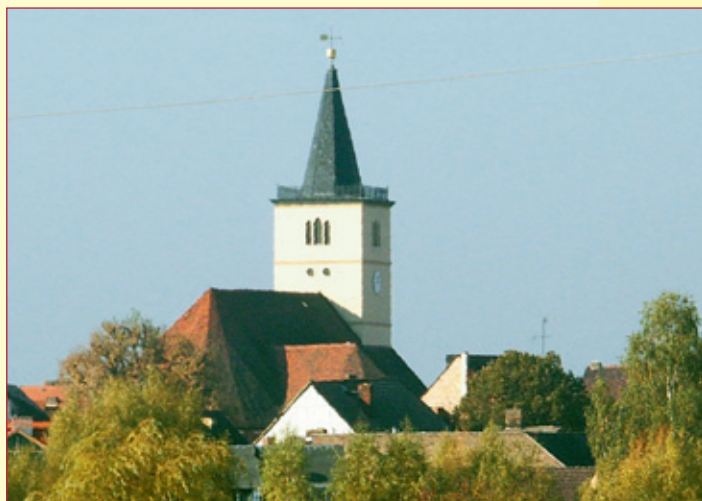
Blick auf Beelitz

Im vorgenannten Ablassbrief wird Beelitz erstmals als „oppidum“ (lat.: Städtchen, Flecken) bezeichnet; 1307 erstmals als „civitas“ (lat.: Stadt), 1321 als Mitglied eines Bundes märkischer Städte. Macht- und Besitzansprüche prägen seine Geschichte. Markgräfliche Bestätigungsurkunden hat Beelitz im Mittelalter u. a. 1341, 1351, 1373, 1411, 1440 und 1452 erhalten. Der ranghöchste Aussteller ist Kaiser Karl IV., der 1373 die Mark Brandenburg für seine Söhne übernahm und am 27. August desselben Jahres in Strausberg urkundlich alle Rechte und Besitzungen der Beelitzer Bürger bestätigte. 1370 genehmigte das Lorenzkloster zu Magdeburg, dem 1280 vom Magdeburger Erzbischof und vom Brandenburger Bischof die Patronatsrechte über die Beelitzer Kirche übertragen worden waren, den Bau einer Kapelle nahe der Beelitzer Kirche für das Wunderblut. Zweifelhaften Ruhm erlangte der „falsche Waldemar“, gegen dessen Ansprüche sich die Beelitzer 1349 wehrten, gemeinsam mit (Treuen-)Brietzen und Frankfurt/Oder zugunsten Markgraf Ludwigs aus dem Geschlecht der bayerischen