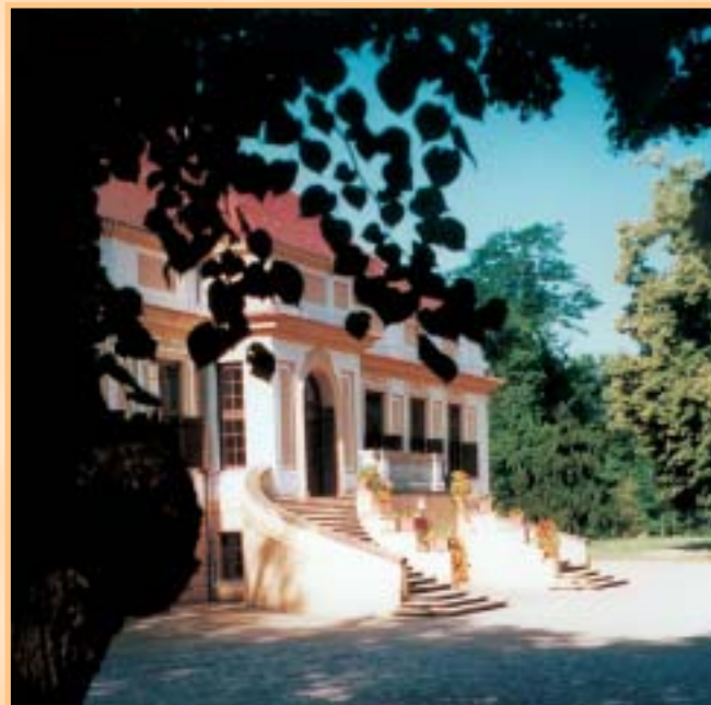
Schloss Caputh

Mit dem Aufblühen Berlins kam die Chance für Caputh: Wenn es nicht von der Havel leben durfte, warum dann nicht auf ihr? Der Wasserweg zwischen Berlin und Hamburg führte doch genau an den Caputher Haustüren vorbei! Dass man nicht schon längst darauf gekommen war! Also wurden Kähne gebaut, zuerst wenige und kleine, dann viele und immer größere. Damit brachte man vor allem im Glindower Raum gebrannte Ziegelsteine ins aufstrebende Berlin. Dort konnten es gar nicht genug davon sein. Glindow produzierte Unmengen und die Caputher transportierten sie! Was die Tragekiepe für die Frau war, wurde die Ziegelkarre für den Mann. Das 19. Jahrhundert war in vollem Gange und mit ihm die große Zeit der Caputher Schiffer.