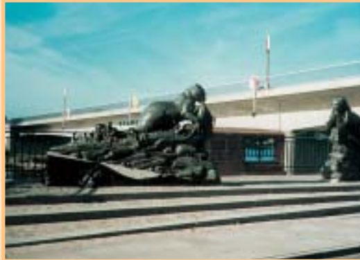
An der Baumgartenbrücke

Vielfältige Eindrücke vermittelt ein Gang über den Franzensberg mit seinen Villen, die sich einst betuchte Berliner als Sommeraufenthaltsstätten erbauen ließen. Hervorzuheben ist besonders ein denkmalgeschütztes Gebäude, die ehemalige „Franksche Villa“, die nach Bauhausarchitektur von einem Sohn des berühmten Sigmund Freud erbaut, nun einen neuen Besitzer gefunden hat und nahezu im Originalzustand wieder hergerichtet wird. Noch beherbergt der Franzensberg auch einen besuchenswerten Tierpark, der aber in absehbaren Zeiträumen umziehen soll. An der höchsten Stelle des Franzensberges steht der Carlsturm, benannt nach dem Bruder Kaiser Wilhelm I., der diesen Turm 1870 als Aussichtsturm errichten ließ. Er ist leider noch nicht wieder begehbar. Die Gemeindevertreter erwägen Pläne, den Turm käuflich zu erwerben und seiner ursprünglichen Nutzung wieder zugänglich zu machen. Eine historische Besonderheit birgt der nördliche Ausläufer des Berges: den Gedenkstein für Ferdinand von Schill und sein 2. Brandenburgisches Husarenregiment, das hier 1809