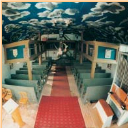
Innenraum der Fercher Kirche

Fährt man vom Potsdamer Platz aus rechts die neu gepflasterte Dorfstraße hinab, passiert man zwei- und dreihundert Jahre alte Fischerhäuser, bewohnt, gepflegt, letztere ganz traditionell mit Rohrdach. Ein gestalteter Platz mit Backofen aus Lehm