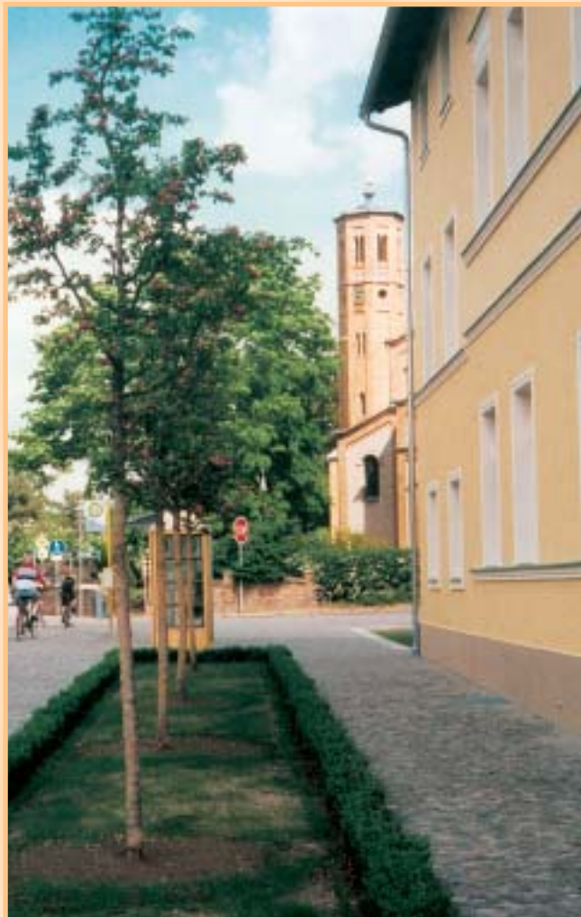
Rathaus und Kirche

Meine Großmutter führte eine Fleischerei. Das Schuldenmachen war damals nicht nur in Künstlerkreisen weit verbreitet. Auch große Teile der Bevölkerung bezahlten erst nach der Obsternte, und selbst Einsteins ließen anschreiben. Die Künstler aber brachten, wenn die Mahnungen der Geschäftsfrau zu häufig wurden und somit Gefahr im Verzug war, gerne eins ihrer Bilder und versuchten damit