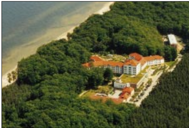
Lage der Reha-Klinik

Indikationen: Lungen- und Bronchialerkrankungen Hautkrankheiten/Allergien Krebserkrankungen/Nachsorge