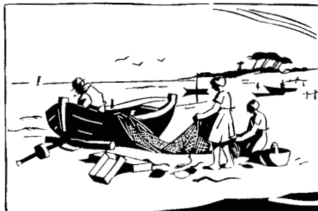
NACH DEM FISCHZUG