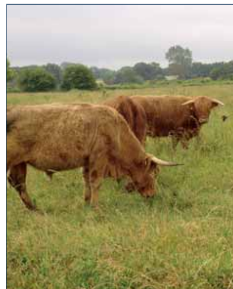
Hochlandrind auf der Birk