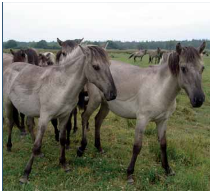
Konies auf der Birk

Holzweg 2, 24376 Kappeln Tel. 04642 81698