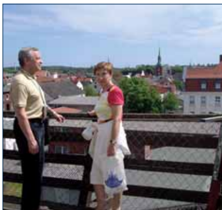
Blick von der Mühl