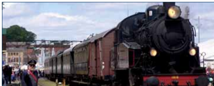
„Die schöne Schwedin“ der Angler Dampfeisenbahn

„Wer rastet, der rostet“. Rüstige Senioren, die im Schwimmbad beständig ihre Bahnen ziehen, Hundertjährige, die auf das tägliche Glas Rotwein schwören, und Großeltern, die die Kinder im Kopfrechnen besiegen. Bis ins Alter aktiv zu bleiben, ist kein Hexenwerk. Wer Anteil nimmt am Leben ringsum, wer Kontakte und Freundschaften pflegt und auch die schönen Dinge und Erfahrungen zu genießen versteht, der bleibt innerlich jung und ist weniger anfällig für Altersbeschwerden und Krankheiten. Ausgehend von diesen Erfahrungen gibt es in unserer Stadt/unserem Landkreis viele Angebote. Diese reichen von Beratungsangeboten über Angebote zur Freizeitgestaltung bis hin zu Begegnungsstätten und Klubs, die allen interessierten Senioren offen stehen.