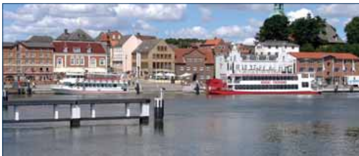
Nordhafen mit Ausflugsdampfer