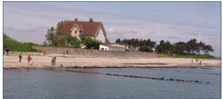
Strand bei Schleimünde