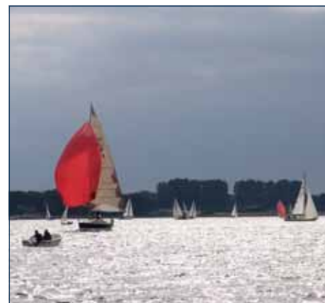
Die Schlei ist ein Super-Segelrevier