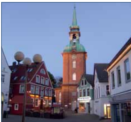
Kappelner St. Nicolai-Kirche