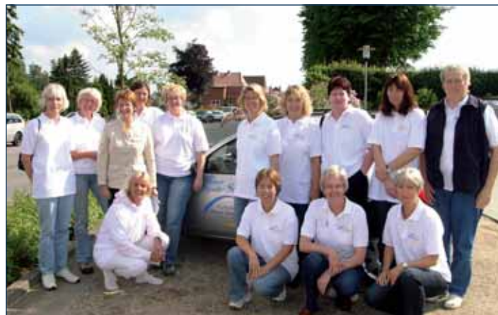
Die APA-Mitarbeiterinnen kommen gerne zu Ihnen nach Hause!

Ambulante Pflege Angeln Diakonisches Sozialzentrum Reeperbahn 4, 24376 Kappeln Tel. 04642 9213390