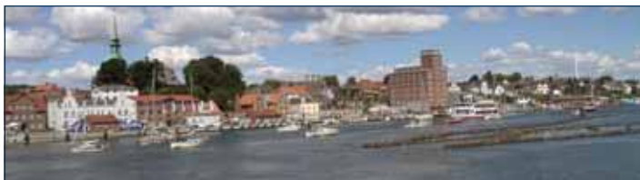
Kappeler Silhouette von Ellenberg gesehen

Die idyllische Hafenstadt Kappeln ist unter anderem bekannt durch die ZDF-Serie „Der Landarzt“, die seit Jahren ein Dauerbrenner im Vorabendprogramm ist. Auch 2009 entstehen hier neue Folgen rund um das Örtchen „Deekelsen“ hinter dem sich u.a. auch die Stadt Kappeln verbirgt.