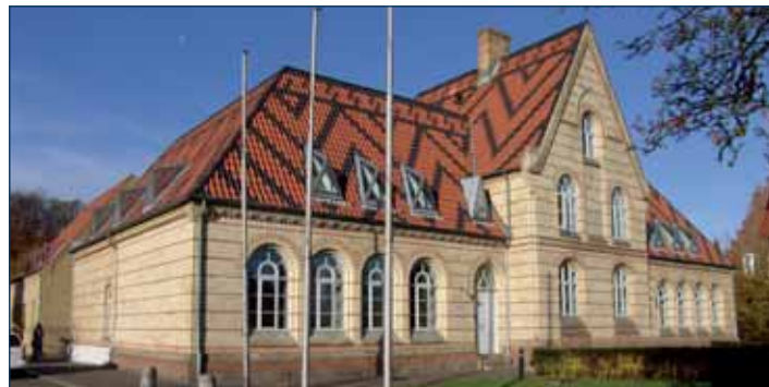
Rathaus der Stadt Kappeln