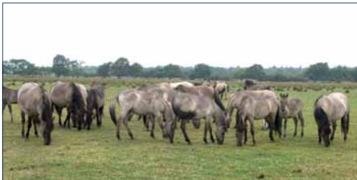
Konies auf der Birk

Eine Krankheit oder ein Unfall können jeden in eine Situation bringen, in der er außerstande ist, für sich selbst zu entscheiden, Wünsche zu äußern und selbstbestimmt zu handeln. Auch wenn Angehörige und andere Vertrauenspersonen um die Wünsche des jeweils anderen wissen, können sie nicht rechtsverbindlich entscheiden und tätig werden. Dafür benötigen sie eine Vertretungsvollmacht.