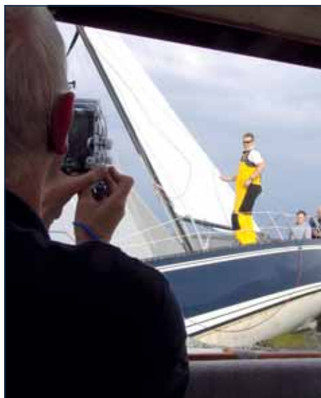
Segeln vor Winnemark

Diakonisches Werk des Kirchenkreises Angeln Mühlenstr. 34, 24392 Süderbrarup, Tel. 04642 929224 Kappeler Werkstätten , Tel. 04642 91440