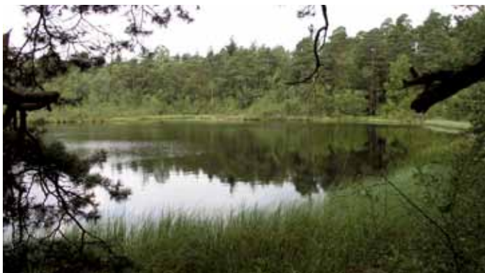
Pastorendiek in Sudwalde