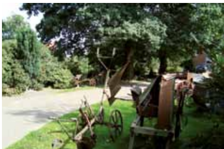
Hof in Scholen