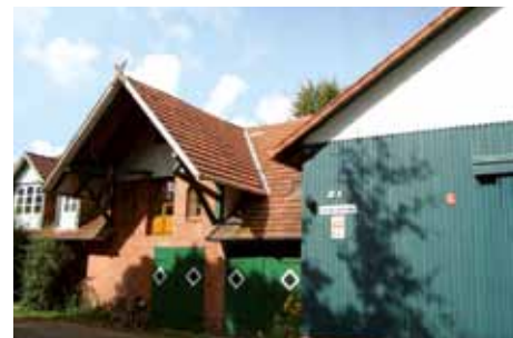
Reisende Werkschule in Scholen