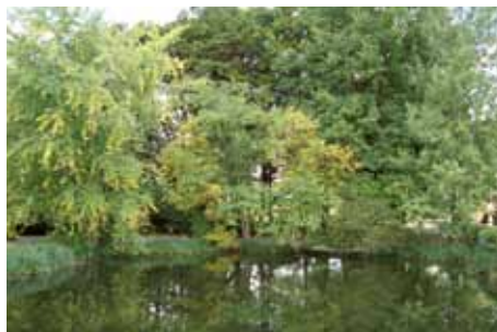
Teichanlage in Schwaförden