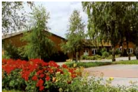
Jugend- und Sporthaus in Affinghausen