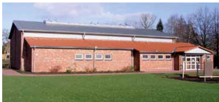
Sporthalle an der Grundschule Sudwalde