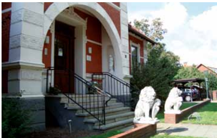
Wohnhaus in Schwaförden