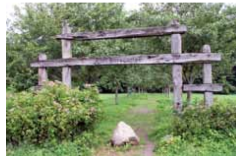
Burggarten in Ehrenburg