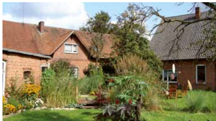
Hof in Scholen