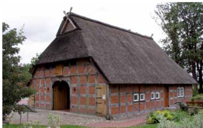
Heuerlingshaus in Sudwalde