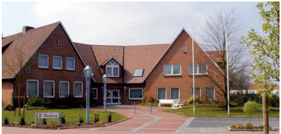
Rathaus in Schwaförden

Nach Terminvereinbarung sind wir auch außerhalb der Sprechzeiten für Sie da!