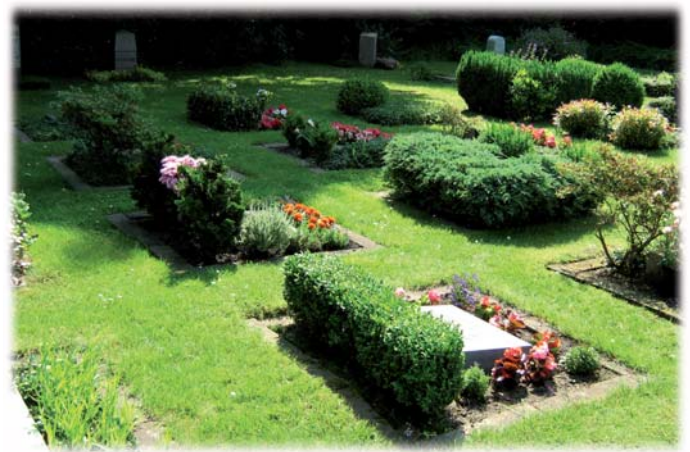
Urnenwahlgräber in Einzellage

Dort werden auch Auskünfte über die verschiedenen Bestattungsarten sowie Gestaltung von Grabmalen und Grabeinfassungen erteilt. Auch bezüglich der Höhe der von der Bestattungsform abhängigen Friedhofsgebühren kann auf Wunsch Auskunft gegeben werden.