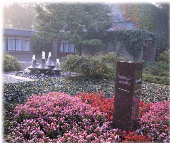
Eingangsbereich Friedhof Spadener Höhe

Krematorium Friedhof Spadener Höhe Spadener Straße 130, 27578 Bremerhaven Tel.: 0471/8060434