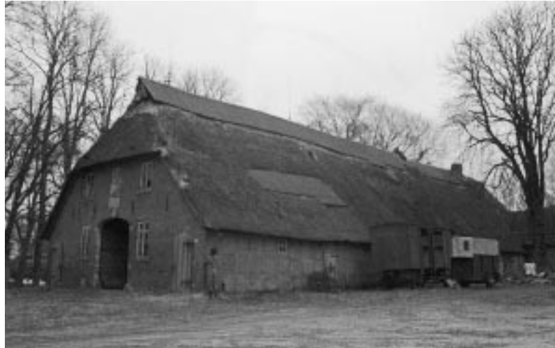
Nicolaus-Böttjer-Haus vor der Sanierung

Der Gemeinderat faßte 1984 den Beschluß, das unter Denkmalschutz stehende Gebäude zu sanieren und zum künftigen Rathaus der Gemeinde auszubauen.