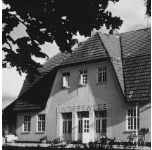
Worpsweder Bahnhof – von Heinrich Vogeler 1910 erbaut