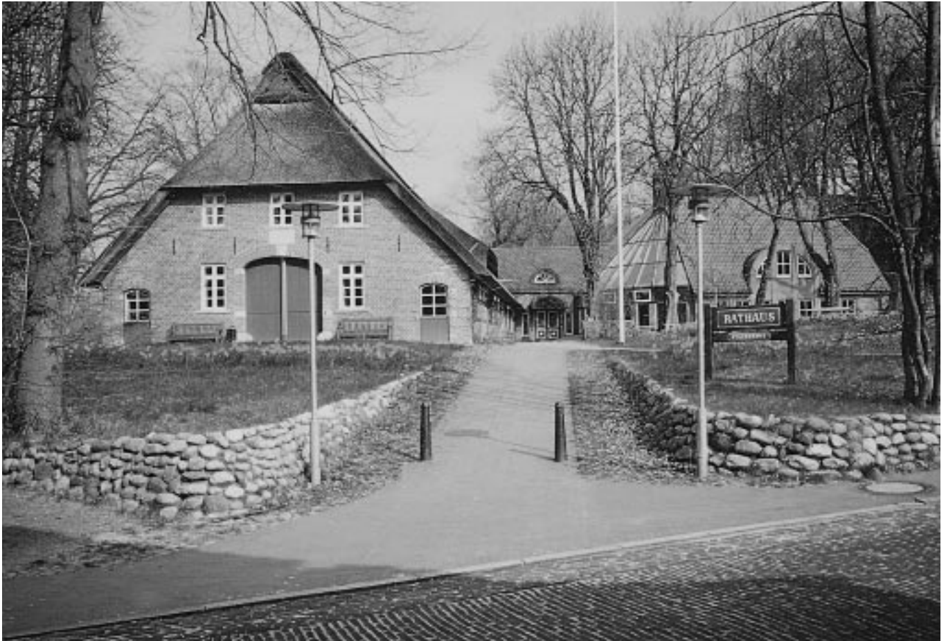
Worpsweder Rathaus – mehr zur Geschichte des Rathauses auf den Seiten 6 und 7.