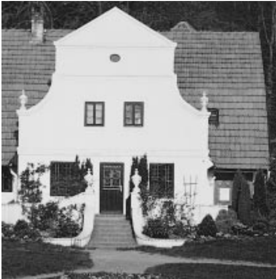
Der Barkenhoff – einst Wohn- und Arbeitsstätte Heinrich Vogelers