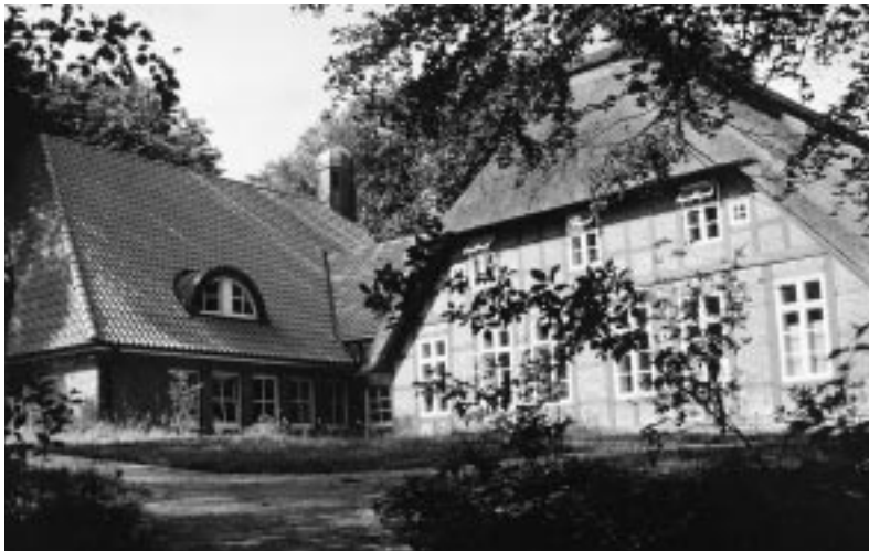
Ost-Ansicht des Rathauses

Es entstand ein würdiges, repräsentatives Rathausgebäude, das nicht nur ein Verwaltungsgebäude, sondern auch ein beliebter Veranstaltungsort ist. Wertvolle, historische gewachsene Baustrukturen wurden bewahrt, behutsam fortentwickelt und den heutigen Bedürfnissen angepaßt.