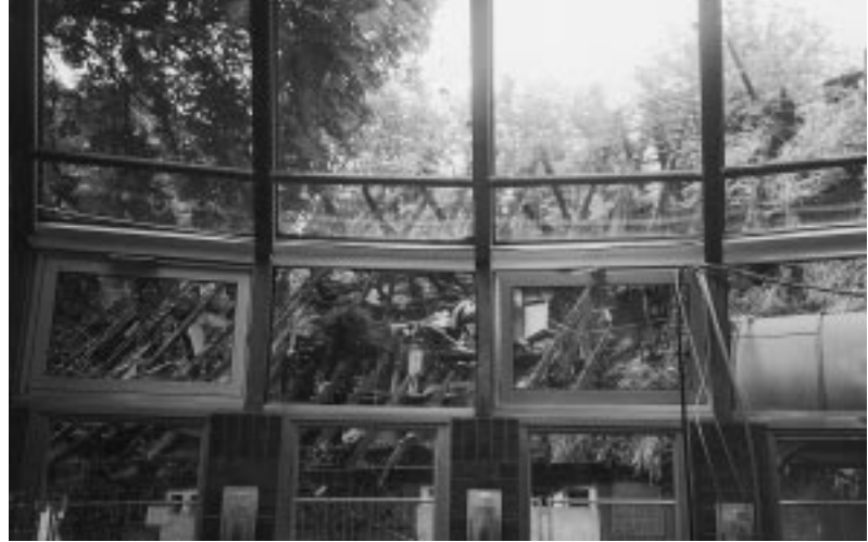
Blick aus dem Anbau auf die Brandruine

Ein Blitzeinschlag verwandelte in der Nacht vom 13. zum 14. Juni 1997 den historischen Teil des Rathauses in Schutt und Asche. Der moderne Anbau blieb durch den massiven Einsatz der Feuerwehr von den Flammen verschont.