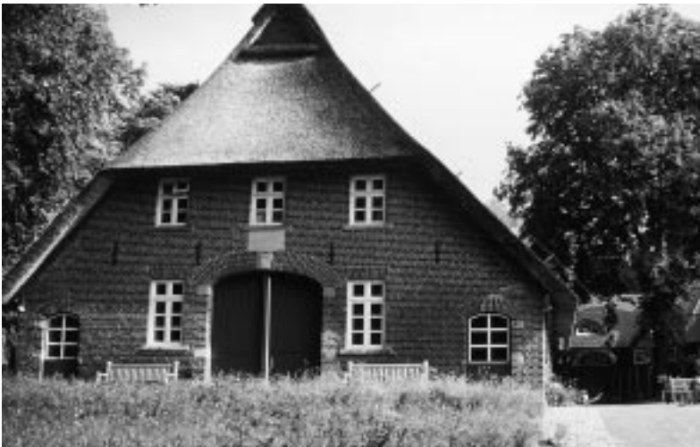
West-Ansicht des Rathauses

Heute erstrahlt das Rathaus wieder in neuem Glanz. Innerhalb von 10 Monaten gelang es, das alte Bauernhaus ohne sichtbare Veränderungen wieder aufzubauen und es wieder zu dem zu machen, was es war: