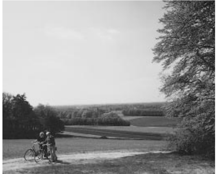
Weyerberg – Blick auf die Hammeniederung