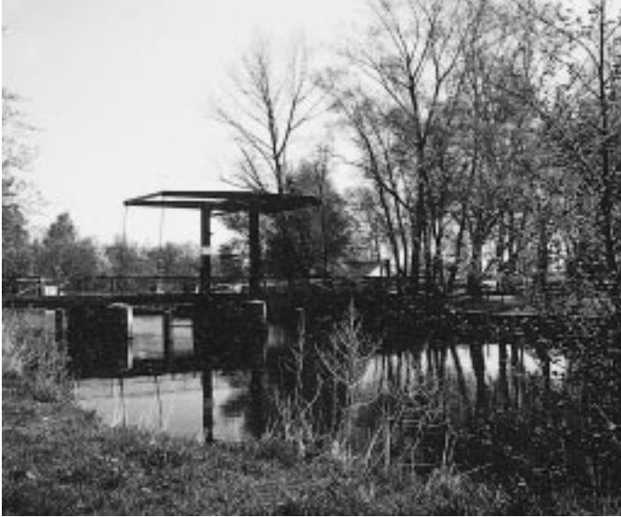
Hamme bei „Neu-Helgoland“ – Fahrtweg der Torfkähne