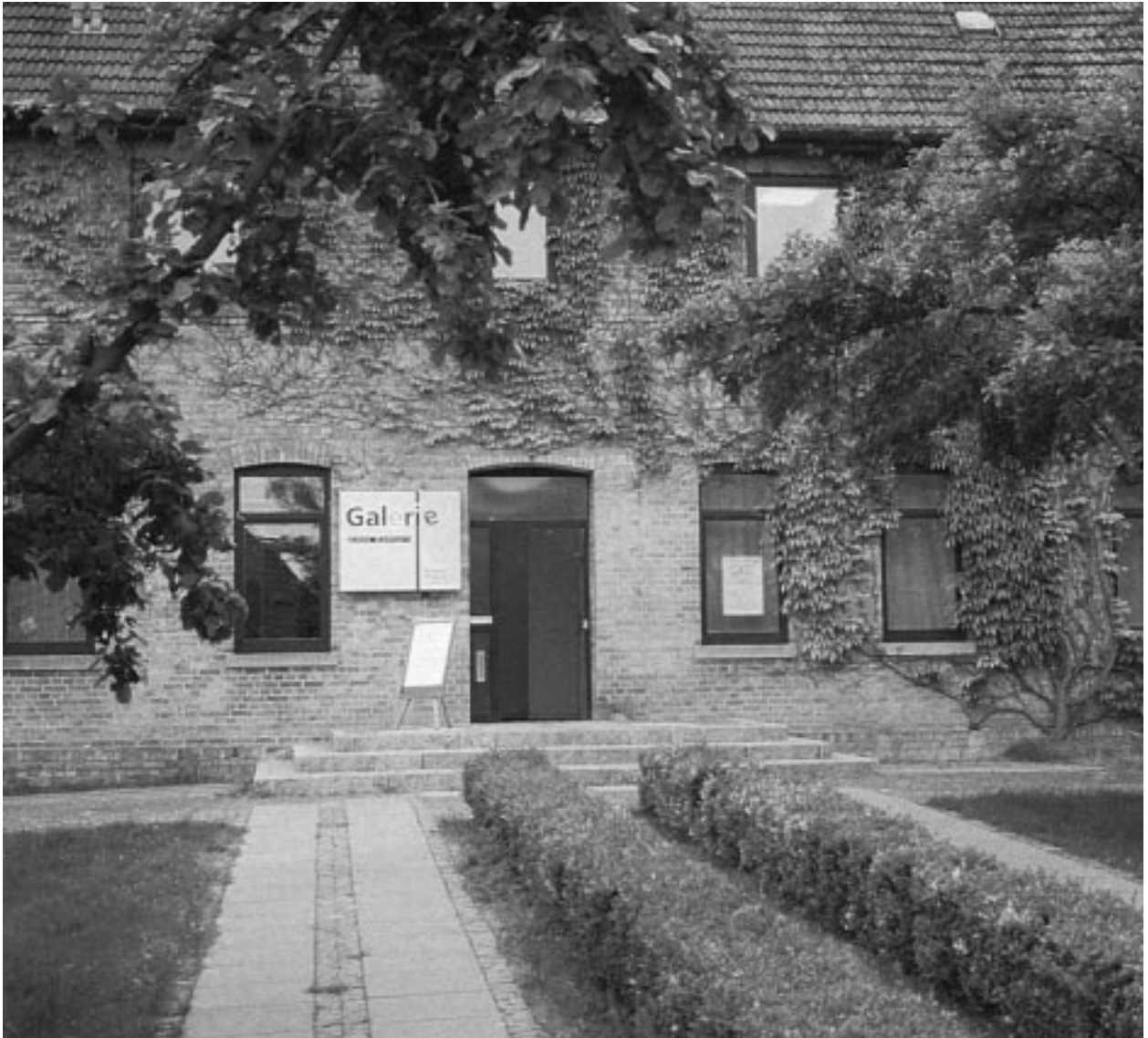
Die Galerie Altes Rathaus – Forum für zeitgenössische Kunst