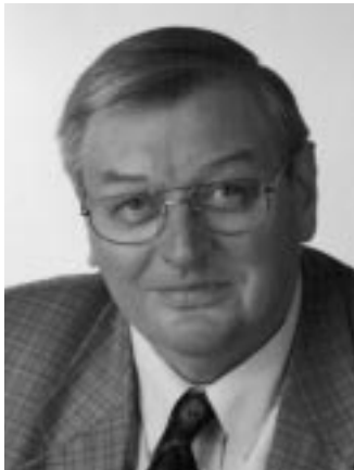
Ihr Bürgermeister - Johann Kück -