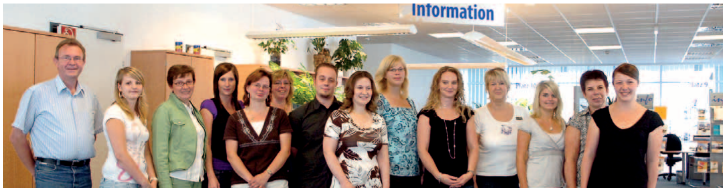
Das freundliche Team des Bürgerbüros

Bei einem Umzug innerhalb Delmenhorsts muss auch die Anschrift in Ihrem Fahrzeugschein bzw. Ihrer Zulassungsbescheinigung Teil I unverzüglich geändert werden. Mehr Informationen erhalten Sie in der Rubik „Straßenverkehr – Kfz-Zulassungsbehörde“ in dieser Broschüre.