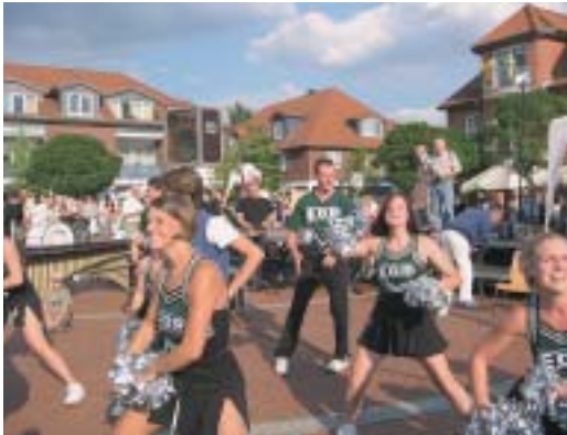
„Cheerleader“ auf dem Marktplatz