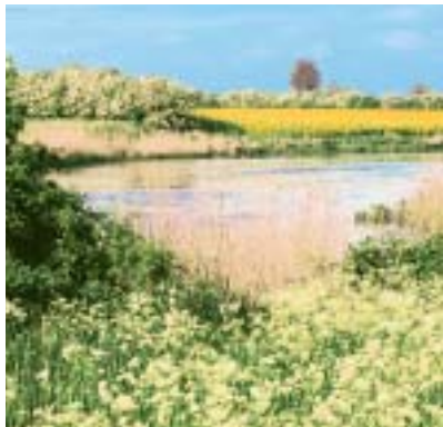
Rieder See (Ahausen)

einem Besuch von Kirchen, Museen und anderen Sehenswürdigkeiten. Wobei wir wieder bei Venedig wären.