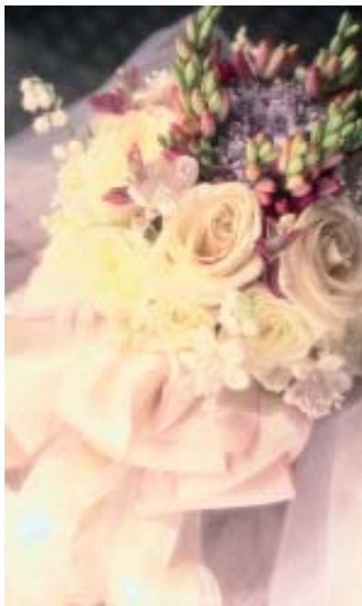
Blumen spielen von Anfang an in der Liebe eine ganz besondere Rolle.

Rosen, Tulpen, Nelken – Blumen spielen von Anfang an in der Liebe eine ganz besondere Rolle. Ob's das erste Rendezvous ist, der Antrittsbesuch bei den künftigen Schwiegereltern, ein Strauß zur Versöhnung oder einfach mal so – man(n) sagt es gern mit Blumen. Erst recht am Tag der Hochzeit – Blumen, wohin das Auge schaut. Auto oder Kutsche werden geschmückt, z. B. mit immergrünem Buchsbaum in Kombination mit weißen oder bunten Blüten.