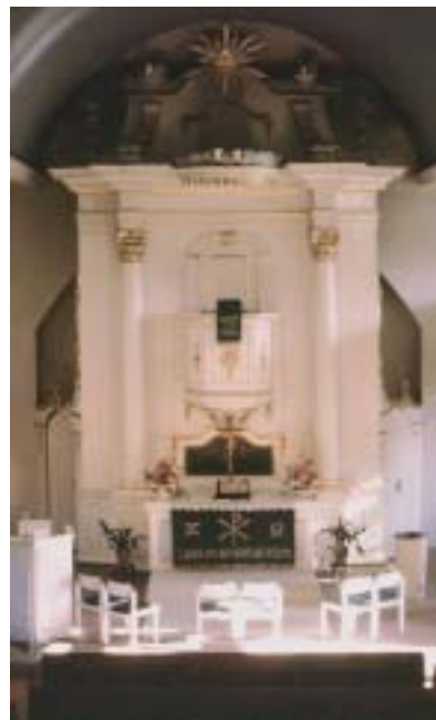
Leester Kirche: Altar

Die meisten haben erfahren, welch eine Gefühlsbewegung eine Trauung beim Brautpaar und bei den Zuhörern hervorgerufen kann, oft auch dann, wenn sie sich zur Teilnahme nur mit großen inneren Vorbehalten entschlossen hatten, weil ihnen alles Feierliche als fremd, peinlich oder gar unaufrichtig erschien.