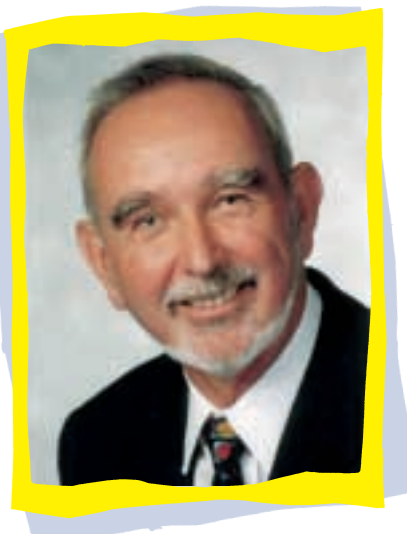
Bürgermeister Klaus D. Richter