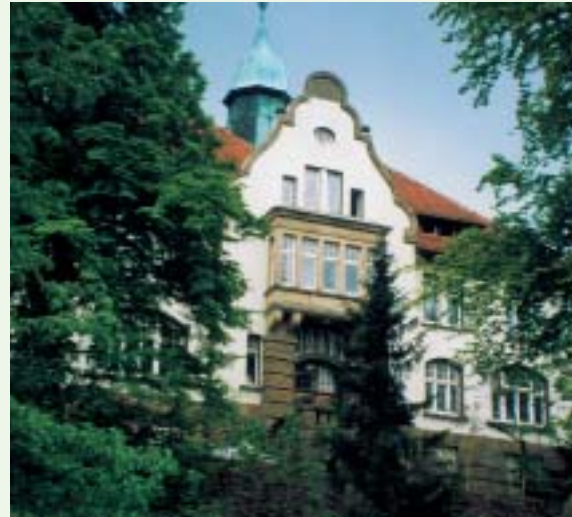
Rathaus der Stadt Porta Westfalica