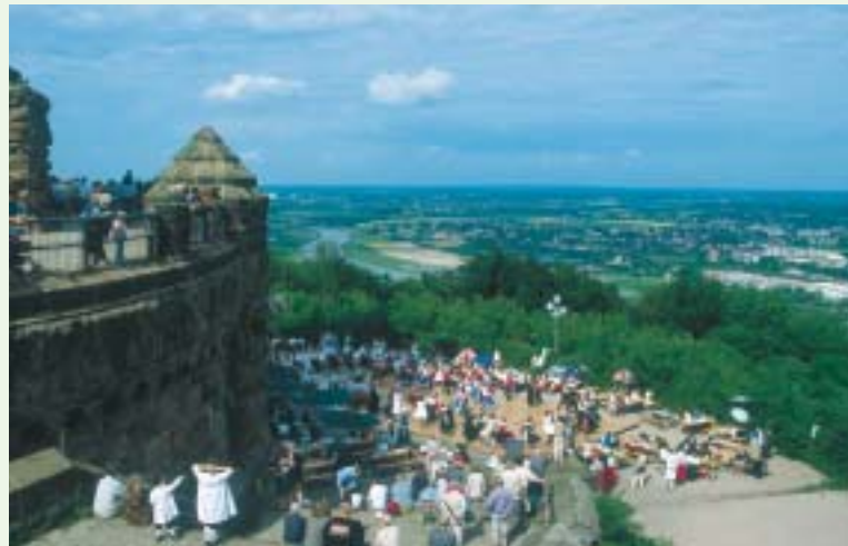
Portafest am Kaiser-Wilhelm-Denkmal,