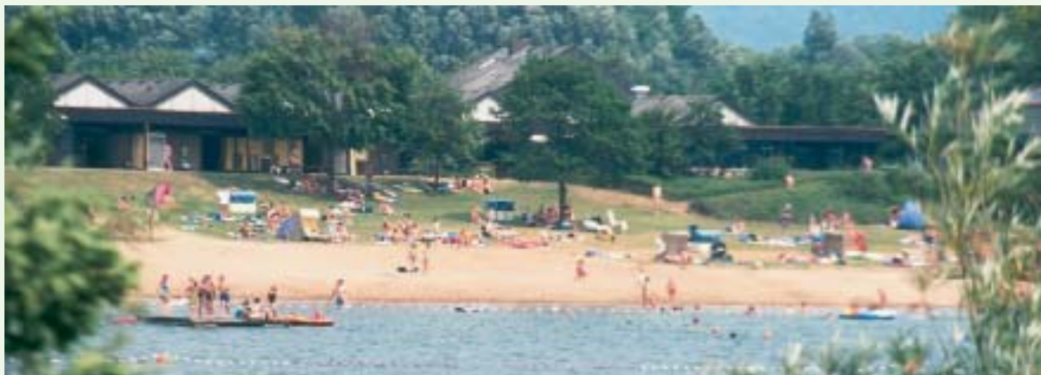
Freibad Großer Weserbogen