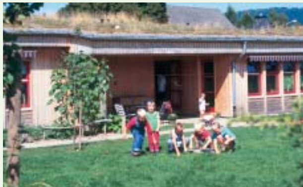
Kindergarten Zwergenland, Holzhausen