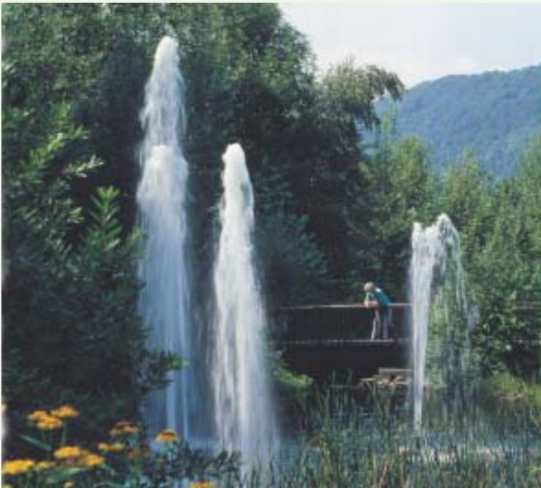
Kurpark der Stadt Porta Westfalica

Im Zentrum des Stadtteils Hausberge gelegen, Konzerte heimischer und auswärtiger Gruppen