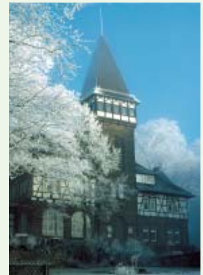
Foto: Im Winter

Die Telefonanschlüsse in Porta Westfalica haben keine einheitliche Vorwahl und sind im Fernsprechbuch in einem Gemeindeeintrag zusammengefasst. Die im folgenden Text ohne Vorwahl angegebenen Telefonnummern liegen im Ortsnetz Minden (Vorwahl Minden: 05 71).