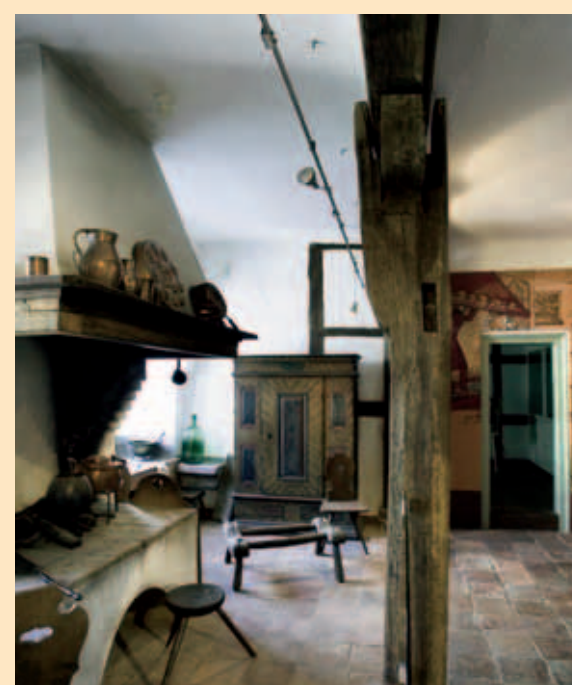
Brüder Grimm Haus