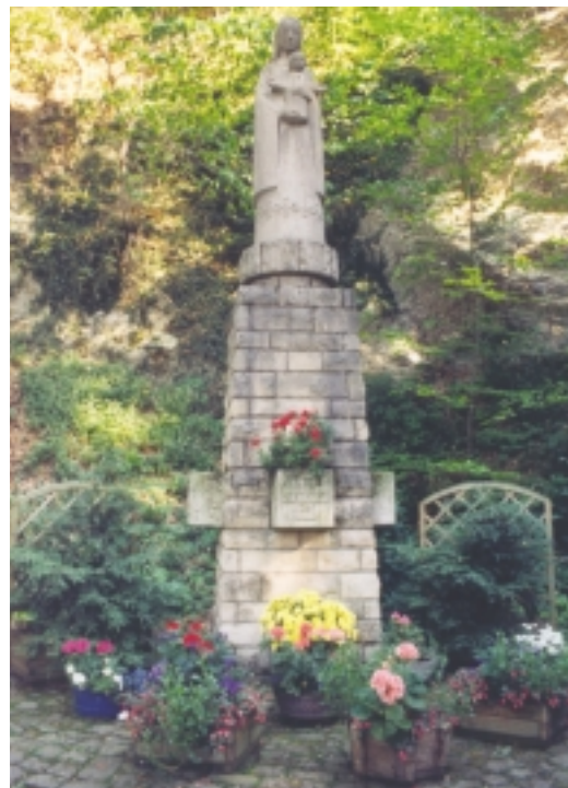
Mutter der heiligen Hoffnung