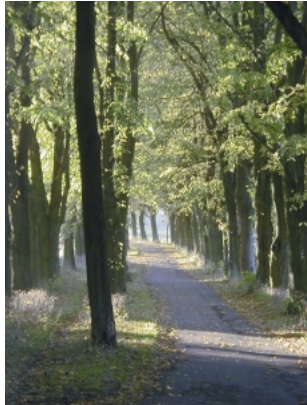
Baumallee zum Hungerberg

Das Windrad süd-östlich von Altenbergen ist eines der wenigen erhaltenen Windräder (Windmotoren). Es wurde in den Jahren 1908-1911 zur Wasserversorgung der Ortschaft errichtet und war bis 1960 in Betrieb. Nach gründlicher Renovierung und Unterschutzstellung als „Technisches Baudenkmal“ ist es seit 1988 wieder funktionsfähig und diente lange Zeit zur Speisung des Dorfteiches in Altenbergen.