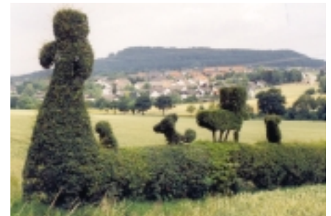
Figurenhecke bei Vörden