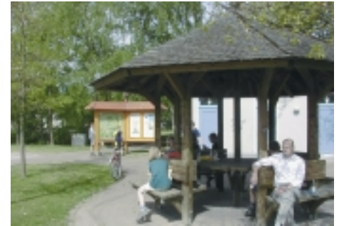
Rad- und Wanderparkplatz