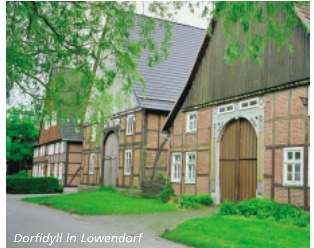
Dorfidyll in Löwendorf

Marienmünster liegt im Grenzbereich des alten Nethegaues im Süden, des Wetigauers im Norden und des Augauers im Osten im ehemals sogenannten Oberwälder Land im nördlichen Kreis Höxter an der Grenze zum Kreis Lippe. Landschaftlich dehnt sich das Stadtgebiet aus vom Rand der fruchtbaren Steinheimer Börde im Westen bis zum Fuß des 500 m hohen Köterberges im Osten. Die südliche und südöstliche Begrenzung bildet die Brakeler Muschelkalkschwelle. Der größte Teil des Stadtgebietes gehört zur sich nach Norden öffnenden Lippischen Keupermulde. Im Norden, Osten und Südosten erhebt sich die Landschaft zu Bergrücken mit Höhenlagen über 300 m ü.N.N. und senkt sich nach Westen und Südwesten allmählich bis 160 m ü.N.N. ab.