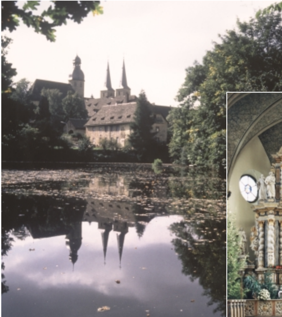
Die altehrwürdige Abteikirche