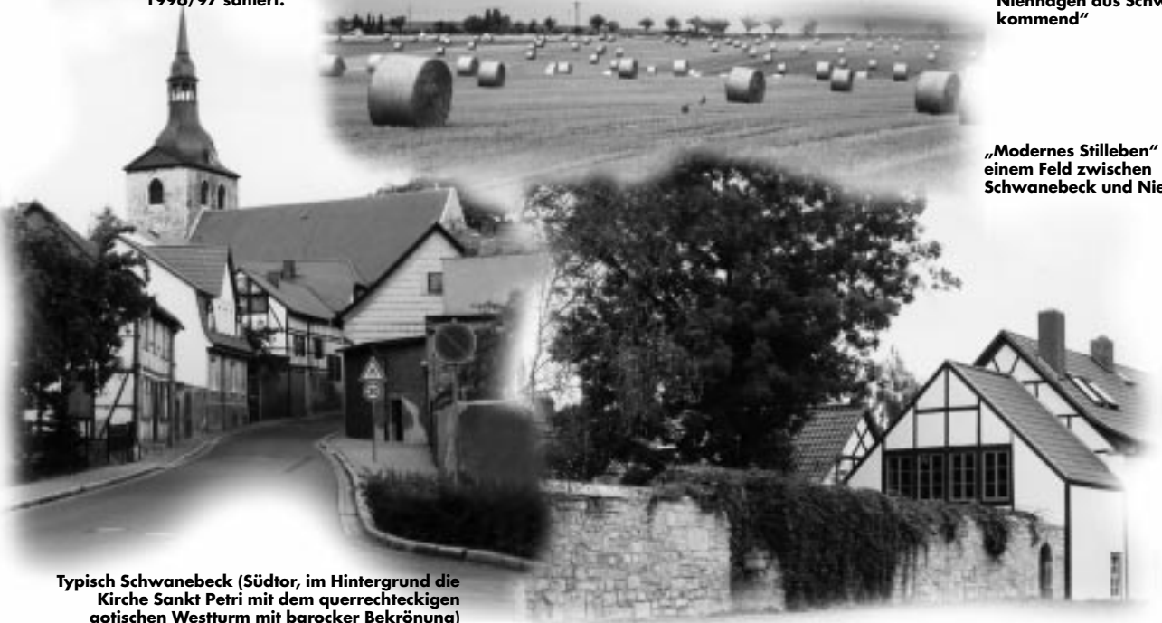
Typisch Schwanebeck (Südtor, im Hintergrund die Kirche Sankt Petri mit dem querrechteckigen gotischen Westturm mit barocker Bekrönung)