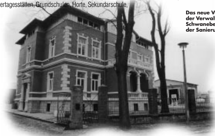
Das neue Verwaltungsgebäude der Verwaltungsgemeinschaft Schwanebeck, bezogen nach der Sanierung im März 1996

Seit 1990 unterhalten die Gemeinde Groß Quenstedt mit der Gemeinde Wathlingen (Landkreis Celle) und die Gemeinde Nienhagen mit der Gemeinde Nienhagen (Landkreis Celle) eine Partnerschaft.