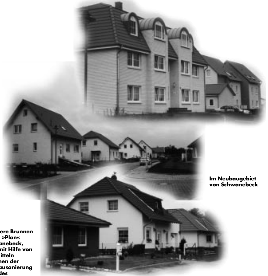
Im Neubaugebiet von Schwanebeck