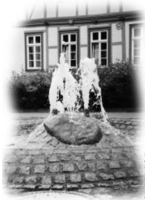
Der frühere Brunnen auf dem »Plan« in Schwanebeck, saniert mit Hilfe von Fördermitteln im Rahmen der Städtebausanierung des Landes

Nienhagen das Gebiet »Woltersweg« (24 Bauplätze) entstehen. Für Bauwillige ist das Verwaltungsamt der Verwaltungsgemeinschaft Schwanebeck erster Ansprechpartner (Telefon: 039424/954-0).