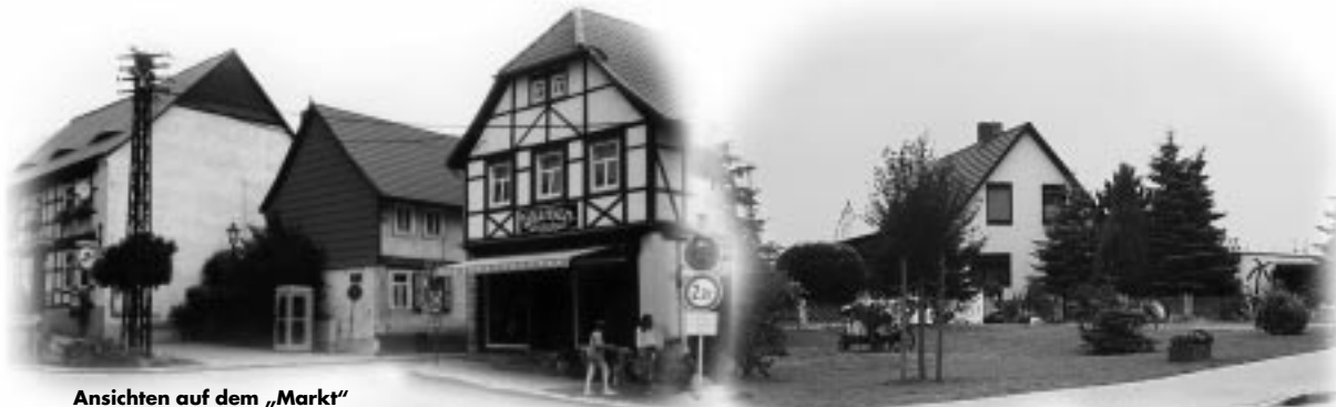
Ansichten auf dem „Markt“ (Stadtmitte) in Schwanebeck. Die denkmalgeschützten Gebäude wurden um 1680 erbaut, 1996/97 saniert.