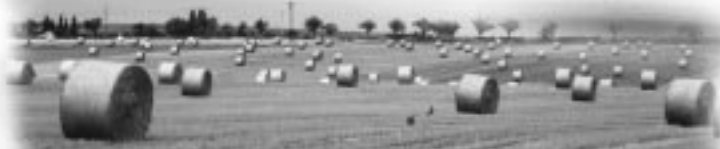
„Modernes Stilleben“ auf einem Feld zwischen Schwanebeck und Nienhagen