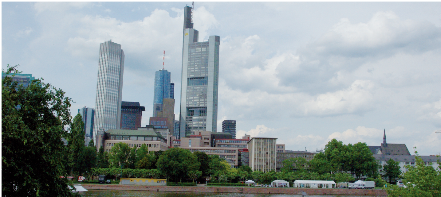
Blick vom Schaumainkai