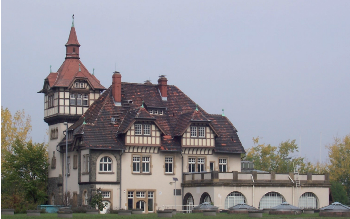
Altes Betriebsgebäude Abwasseranlage