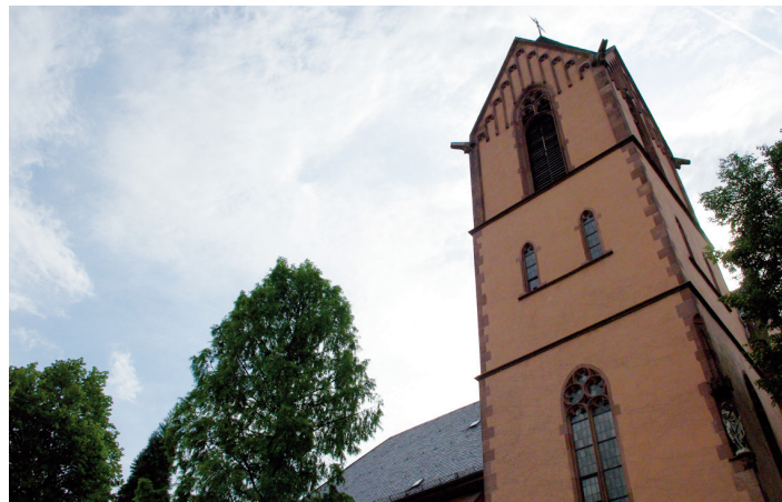
Herz Jesu Kita und Kirche

Buchrainstraße 26-28 60599 Frankfurt am Main Tel.: 069 654317 E-Mail: jz-ffm@gmx.de