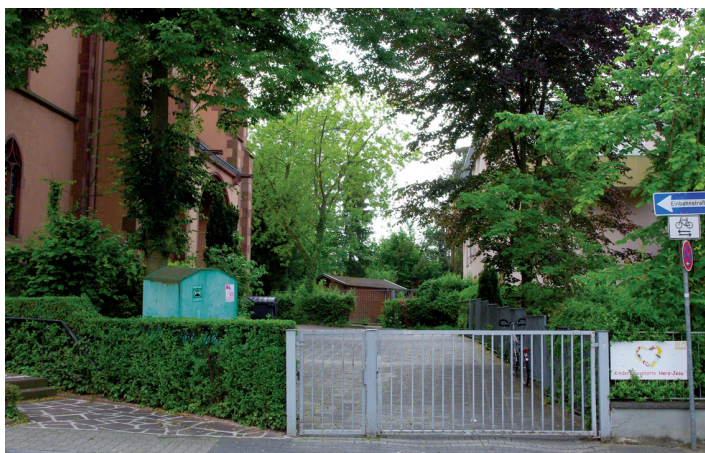
Herz Jesu Kita

Buchrainplatz 60599 Frankfurt am Main Öffnungszeiten Sa 07:00 – 13:00 Uhr