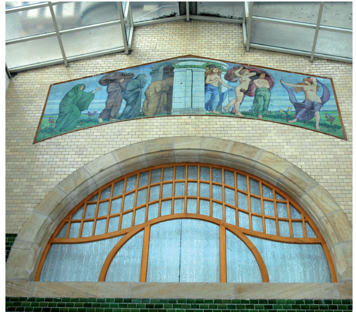
Allegorie Jungbrunnen Abwasseranlage

Die «Stadtteilparlamente» üben eine Mittlerrolle zwischen der Bevölkerung in den Stadtteilen und der Stadtverordnetenversammlung aus. Dabei bringen sie ihre genauen Kenntnisse der Probleme vor Ort ein und sind zugleich näher an der Bevölkerung. Grundsätzlich müssen sie daher zu allen Fragen, die den Ortsbezirk betreffen, von der Stadtverordnetenversammlung oder dem Magistrat gehört werden, insbesondere aber vor der Verabschiedung des städtischen Etats.