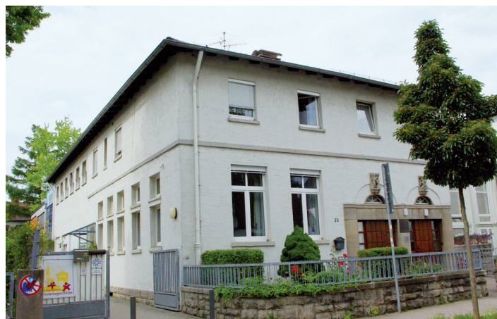
Kita der Erlöserkirche