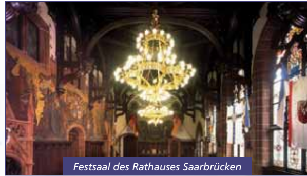
Festsaal des Rathauses Saarbrücken

10.00 Uhr, 10.30 Uhr, 11.00 Uhr, 11.30 Uhr, 14.00 Uhr, 14.30 Uhr, 15.00 Uhr