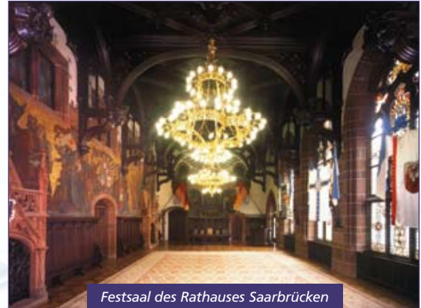
Festsaal des Rathauses Saarbrücken