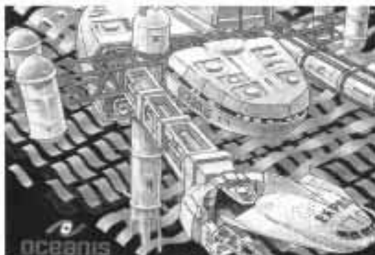
Konzeption und Realisation von „OCEANIS“: Mills & Partner GmbH, Agentur und Ateliers, Stuttgart, Lippeneier + Partner, Architekten, Düsseldorf

Auf der Expo '98 in Lissabon stellt die Deutsche Pavillon die Unterwasserstation „OCEANIS“ dar.