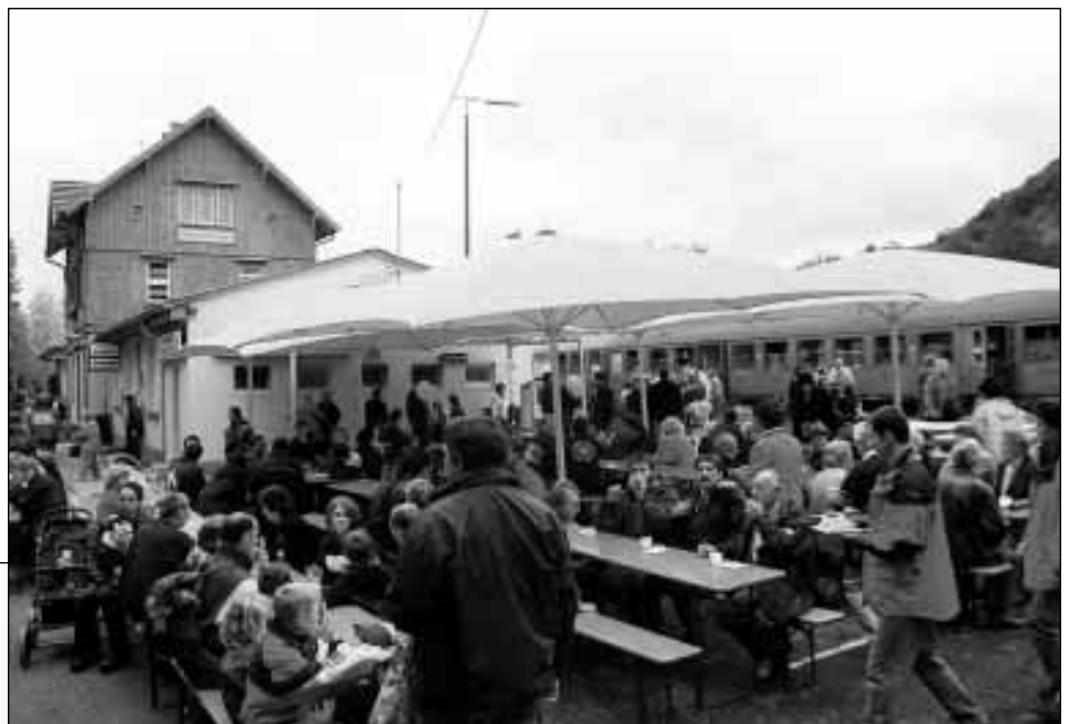
Viele Gelegenheiten für Feste und Feiern gibt es in allen Ortsteilen. Hier z.B. das 100jährige Jubiläum der Teckbahn