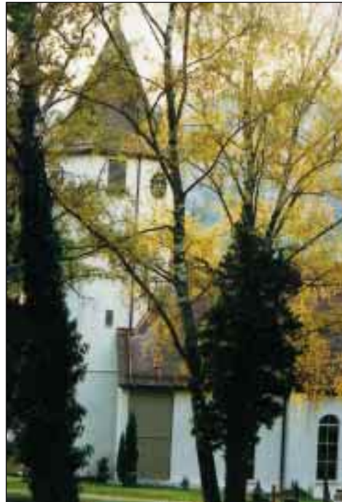
Die Ulrichskirche in Unterlenningen