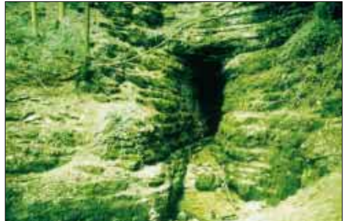
Das Goldloch in Schlattstal ist der Ursprung der Schwarzen Lauter