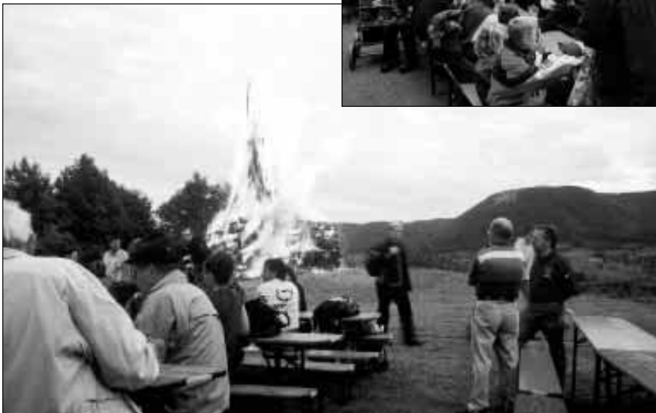
Sonnwendfeuer in Brucken