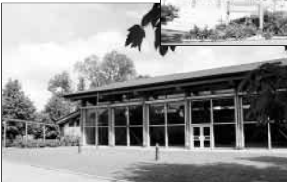
Die Mehrzweckhalle in Schopfloch

Auch Trendsportarten können in Lenningen ausgeübt werden.