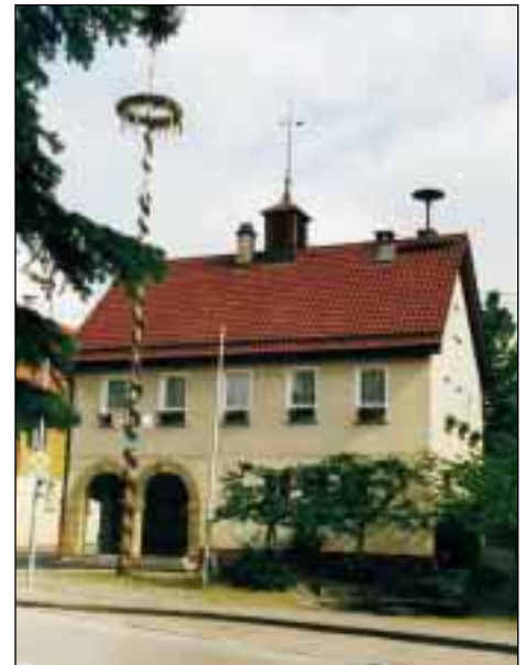
Das Rathaus in Schopfloch

Gutenberg wurde 1285 in Besitz der Herzöge von Teck zum ersten Mal urkundlich erwähnt. Wie Funde aus dem Heppenloch der Gutenberger Höhle beweisen, haben dort schon die Menschen der Jungsteinzeit (5000 – 1800 v. Chr.) und der Hallstattzeit (800 – 400 v. Chr.) Schutz gesucht. Gutenberg erlangte 1360 sogar Stadtrecht, sank jedoch durch die Entvölkerung im 30jährigen Krieg wieder zum Dorf ab. Seit dem 15. Jahrhundert bildete Gutenberg mit Krebsstein und