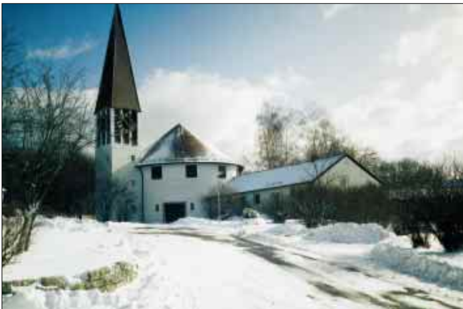
Die Dreifaltigkeitskirche in Hochwang