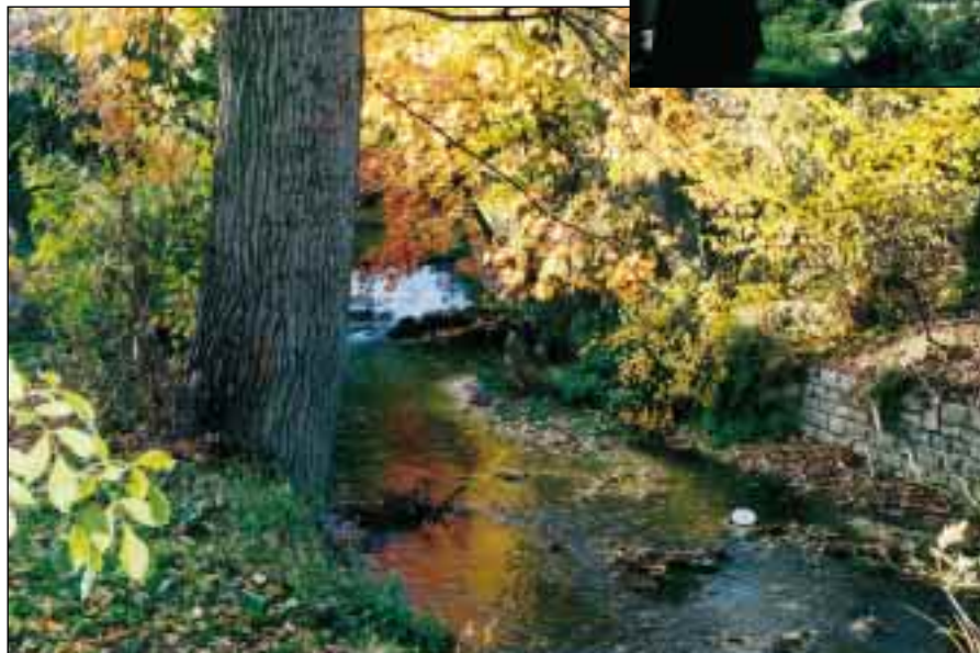
Herbststimmung an der Lauter