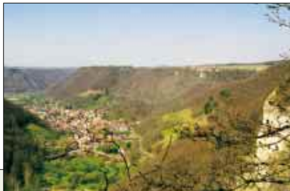
Die Burgruine Sulzburg bewacht den Ortsteil Unterlenningen

Nicht abschließend aufgezählt werden können hier all die baulichen und landschaftlichen Sehenswürdigkeiten , welche Lenningen zu bieten hat. In Oberlenningen besonders zu erwähnen ist das „Schlössle“, ein erst in den vergangenen Jahren aufwendig renovierter, mit mehreren Anbauten versehener dreigeschoßiger Renaissancebau mit Fachwerk. (Siehe auch Seite 13). Die Martinskirche in Oberlenningen aus dem 11/13. Jahrhundert ist zudem eines der wertvollsten Bauwerke im romanischen Stil des Kreises. Eine ganze Reihe von Burgen und Burgruinen, welche zum Erkunden einladen, durchziehen das Tal.