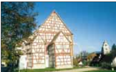
Das Schlössle in Oberlenningen

Denkmalpflegerische Zielsetzung bei der Renovierung war, das Gebäude in seinem ursprünglichen Zustand möglichst unberührt zu erhalten, zu reparieren, jedoch nichts auszutauschen oder hinzuzufügen. Selbst wenn hinsichtlich der späteren Nutzung in Einzelfällen Kompromisse gemacht werden mussten, konnte die vorgefundene Bausubstanz doch mit allen ihren Funden möglichst unberührt, lediglich restauriert und, wo unumgänglich ergänzt, in ihrem Befund erhalten bleiben. Dabei wurde das Fachwerk wieder vollständig freigelegt und die roten Fachwerkkassungen und rot-schwarzen Bandlerierungen unter dem Dach wieder in der ursprünglich farblichen Fassung aufgetragen. Die Fensterfronten in den Stuben des 1. und 2. Stockwerks konnten nach Funden zuverlässig restauriert werden, wobei die gelbe Farbe der Ziehläden der früheren Bemalung entspricht. In den Innenräumen konnten unter anderem umfangreiche Wand- und Deckenbemalungen konserviert und freigelegt werden.