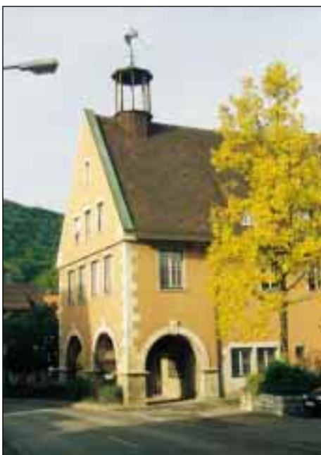
Das Rathaus – Ortsmittelpunkt in Oberlenningen