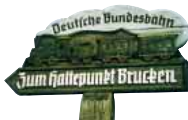
Die Teckbahn fährt bis Oberlenningen ins Lenninger Tal