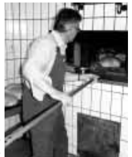
Die Tradition des Backens im Backhaus wird in 6 Backhäusern der Gemeinde aufrechterhalten