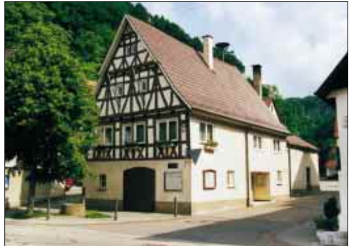
Das Rathaus in Gutenberg

So ist Lenningen heute eine landschaftlich reizvoll gelegene Gemeinde mit schönen Wohngebieten, einem guten Arbeitsangebot und einer Infrastruktur, die vom Kindergarten über Schulen, Mehrzweckhallen bis hin zu den traditionellen Backhäusern und einem reichen Vereinsleben ihren Bürgerinnen und Bürgern viel Lebensqualität und ihren Besuchern viel Sehenswertes bieten kann.