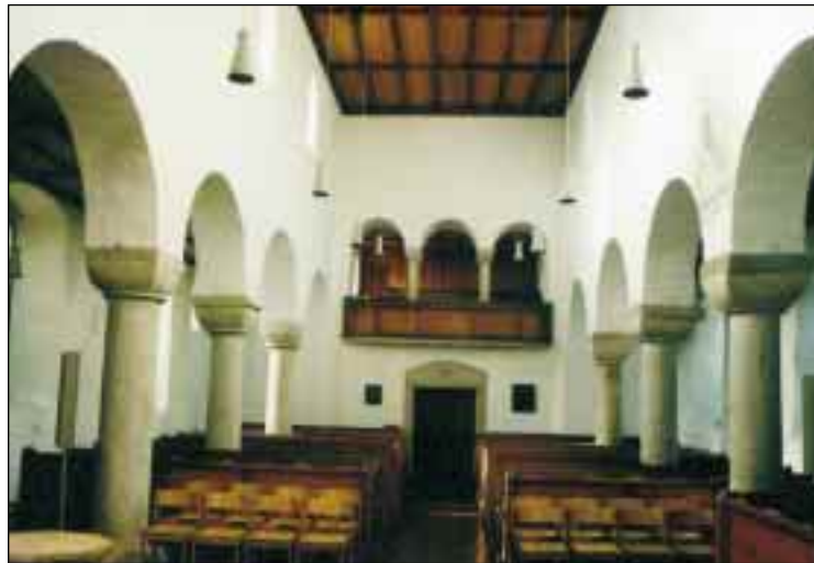
Die romanische Säulenbasilika im Inneren der Martinskirche in Oberlenningen

Die evangelische Martinskirche ist die älteste Kirche im Lenninger Tal und wohl eine Missionskirche, eine Filiale der Kirchheimer Martinskirche, deren fränkischer Ursprung feststehen dürfte. Ob mit der Kirchengründung der Ort entstanden ist, bleibt fraglich, da der Name Oberlenningen auf alemannische Gründer hinweist. Kirchengründung und Vorgängerbauten liegen im Dunkeln. Der Charakter der heutigen Kirche wird wesentlich durch die romanische Säulenbasilika des 11. Jahrhunderts bestimmt: die breite Säulenhstellung und die schmucklosen Polsterkapitelle fallen aus der deutsch-romanischen Baukunst heraus. Das Kirchenschiff wurde im 14. Jahrhundert mit Fresken ausgemalt, die teilweise wieder freigelegt wurden. Ende des 15. Jahrhunderts wurde ein spätgotischer Chor mit fünfgeschossigem Turm angebaut. Nach der Reformation wurden in die Seitenschiffe große Fenster eingebrochen, um für den evangelischen Predigtgottesdienst den Innenraum heller zu machen.