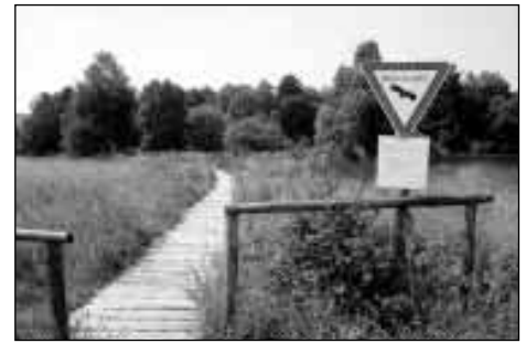
Das Schopflocher Torfmoor beim Weiler Torfgrube