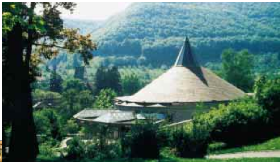
Die Aussegnungshalle in Oberlenningen