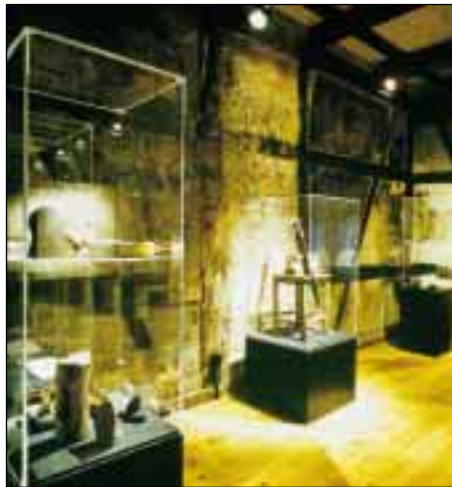
Blick in das Museum für Papier- und Buchkunst in Oberlenningen

Die historische Bausubstanz des alten Lenninger Ortsadelssitzes ist ein geradezu idealer Rahmen