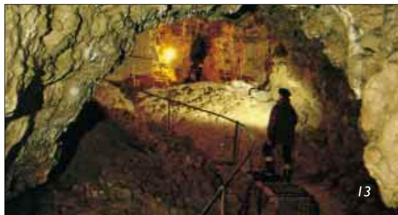
Die Gutenberger Höhle, ein beliebtes Ausflugsziel

Eine besondere Sehenswürdigkeit sind die am Ende des Tiefentals in Gutenberg hoch über dem Ort liegenden Gutenberger Höhle und Gußmannshöhle. Sie sind entweder vom Gutenberg über den Wanderweg vom Tiefental oder von oben her vom „Höhlenparkplatz“, dem Parkplatz an der Kreisstraße von Schopfloch Richtung Krebsstein, erreichbar.