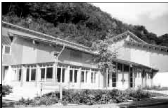
Die Schloßberghalle in Gutenberg

Auch Trendsportarten können in Lenningen ausgeübt werden.