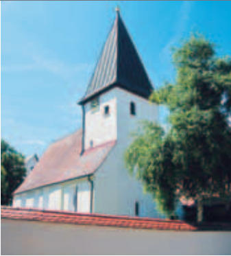
Kirche in Reutti