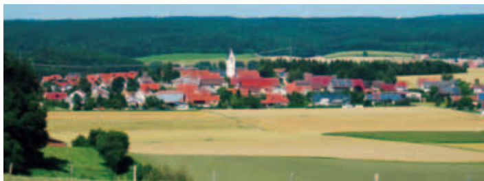
Amstetten lädt zum Wandern ein

Die Wanderkarte gibt es für 50 Cent auf dem Rathaus Amstetten, Zimmer Nr. 101.