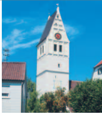
Kirche in Amstetten-Dorf