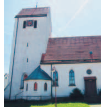
Kirche in Stubersheim