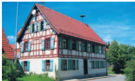
Altes Schulhaus Stubersheim

ITES Vertriebs GmbH Tel.: (07331) 710180 Fax: (07331) 710183 ites.vertrieb_gmbh@t-online.de