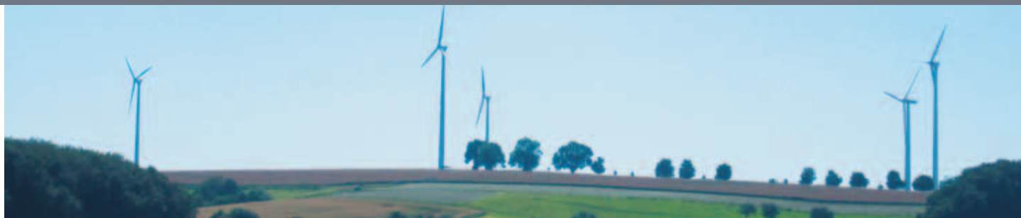
Windräder bei Amstetten-Dorf