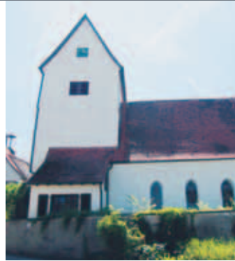
Kirche in Bräunisheim