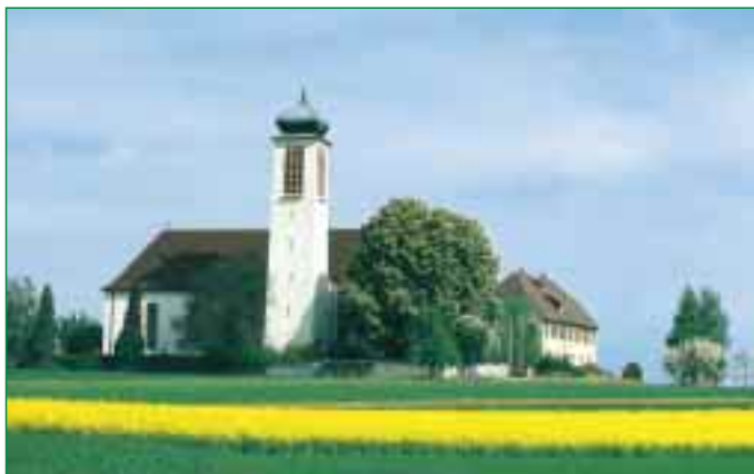
Höchstberg – Wallfahrtskirche „Unserer Lieben Frau vom Nußbaum“