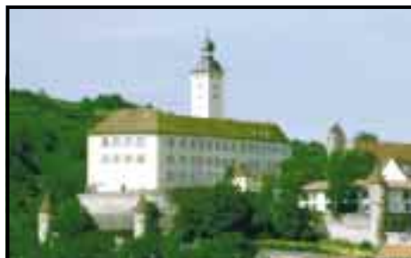
Schloss Horneck 74831 Gundelsheim

Im Lorscher Codex als „Diepenbach“ 773 erwähnt; im 14./15. Jahrhundert erhält der Deutsche Orden die Dorfgemeinschaft. 1806 württembergisch. 1747 erbaut die Kommende Horneck eine Jakobuskirche (jetzt Wohngebäude); 1900 – 1902 wird die heutige Pfarrkirche an der Straße nach Gundelsheim errichtet, auch sie ist dem hl. Jakobus geweiht. Tiefenbach lieferte nach 1860 große Mengen an Baumaterial für die Nachbargemeinden, aber auch in die weitere Umgebung. Es wurden Kalk und Ziegel hier gebrannt: begehrt war vor allem als natürlicher Baustein von guter Qualität der Tiefenbacher Sandstein. Am 2. und 3. April 1945 kommt es inmitten des Dorfes zu erbitterlichen Kämpfen zwischen deutschen und amerikanischen Einheiten. Aus Dankbarkeit darüber, dass dabei kein Tiefenbacher umgekommen ist, wurde in der Allfelder Straße ein Bildstock errichtet. Tiefenbach gehört seit 1.9.1971 zur Stadt Gundelsheim.