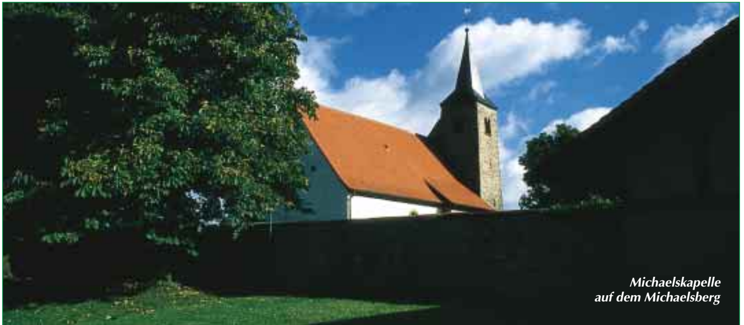
Michaelskapelle auf dem Michaelsberg