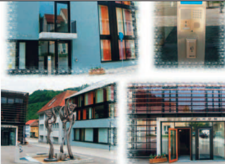
Rathaus der Stadt Zell