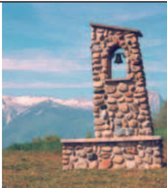
Hochalpen bei Embrun