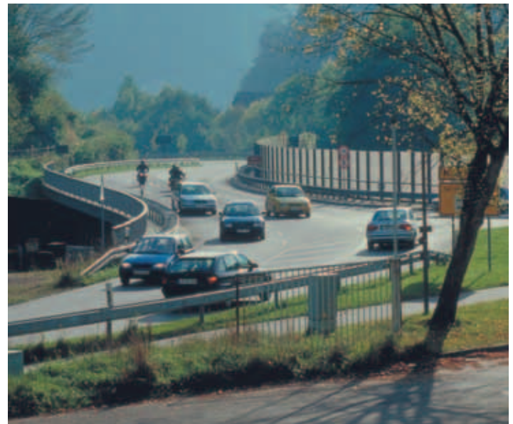
B 317, Einfahrt Zell-Nord