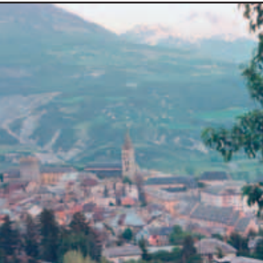
Partnerstadt Embrun in Frankreich