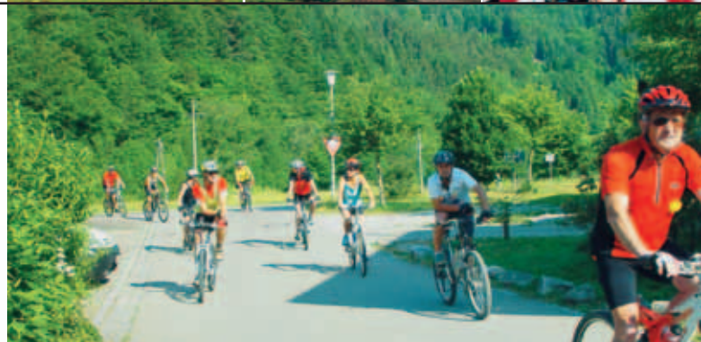
Bike-Touren im Zeller Bergland