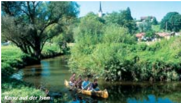
Kanu auf der Isen

Städtisches Freibad – Eissporthalle – Tennisanlage – Spiel- und Sportplätze – Rad- und Wanderwege – Stadtpark – Naherholungsbereich am Stadtrand.