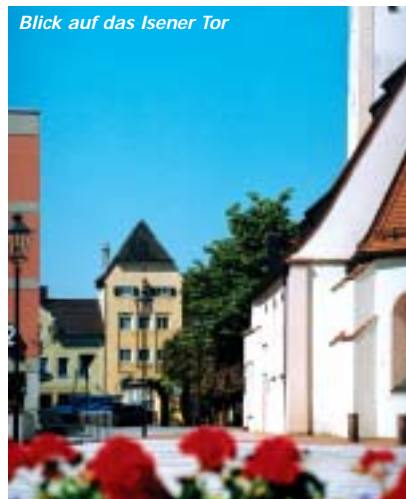
Blick auf das Isener Tor