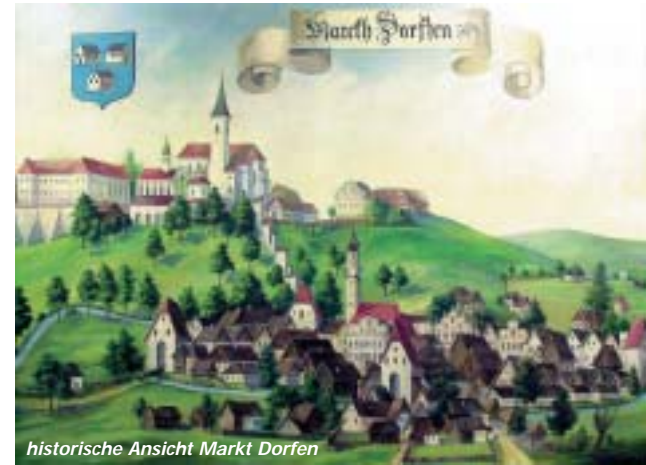
historische Ansicht Markt Dorfen

Die niederbairischen Herzöge statteten den Markt mit Rechten und Freiheiten aus und verliehen ihm 1331 das Landshuter Marktrecht mit zahlreichen Verbesserungen gegenüber den früheren Privilegien. Dorfen wurde zum Sitz eines Landrichters und bekam