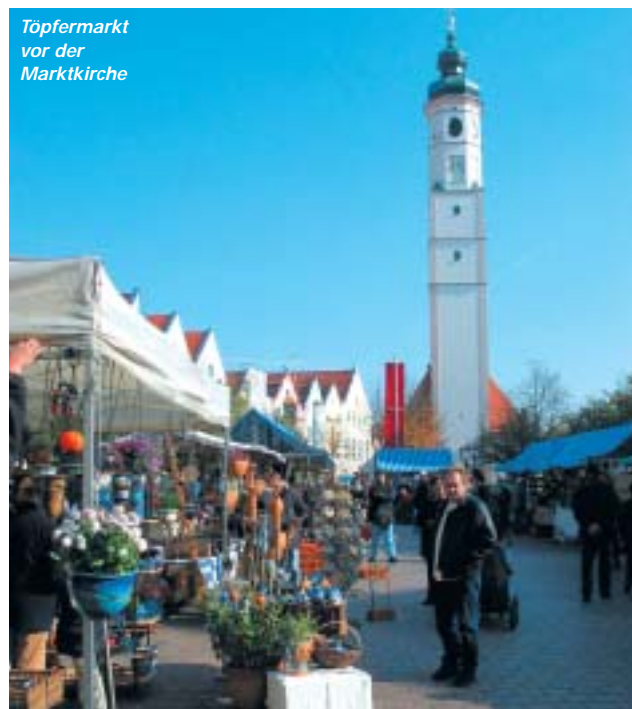
Töpfermarkt vor der Marktkirche

Denkmäler in der Innenstadt: Hemadlenzenbrunnen, Floriansbrunnen, Mariensäule, Nepomuk auf der Isenbrücke. Sehenswert ist auch der Skulpturenweg am Hochwasserbecken.