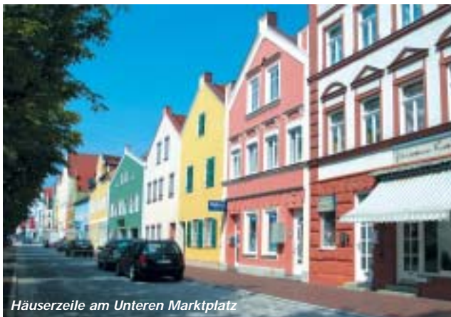
Häuserzeile am Unteren Marktplatz