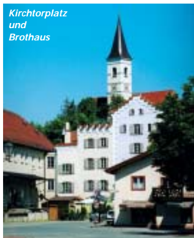
Kirchtorplatz und Brothaus

Der Name Dorfen erscheint erstmals in einer Urkunde vom 28. August 773. Er bezieht sich jedoch vermutlich auf das heutige Oberdorfen. Aus dem ältesten bairischen Herzogsurbar, dem "urbarium antiquissimum" geht hervor, dass der Markt Dorfen entweder von Herzog Ludwig dem Kelheimer (1208 - 1231) oder von seinem Nachfolger, Herzog Otto II. der Erlauchte (1231 - 1253) zwischen 1229 und 1237 gegründet wurde. Bereits 1270 wird Dorfen erstmals ausdrücklich als Herzoglicher Markt bezeugt. Das Wappen des Marktes Dorfen ist in Siegelabdrucken von 1374 und 1394 überliefert. Der mittelalterliche Markt Dorfen war mit einem verstärktem Wall und einem davor liegenden Wassergraben sowie mit vier Toren umwehrt. In sehr kurzer Zeit entwickelte sich Dorfen zum wirtschaftlichen Mittelpunkt nicht nur des Isentales, sondern des ganzen markt- und städtelosen Gebietes des südöstlichen Niederbairn zwischen Landshut, Wasserburg, Erding und Mühldorf.