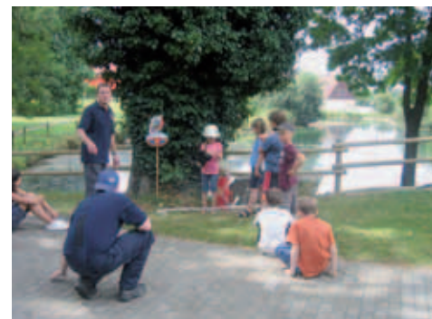
■ Feuerwehr Winterstettenstadt Ferienprogramm