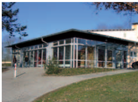
■ Mehrzweckhalle Ingoldingen