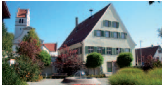
■ Rathaus Ingoldingen