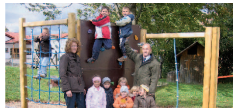
■ Kindergarten Winterstettendorf