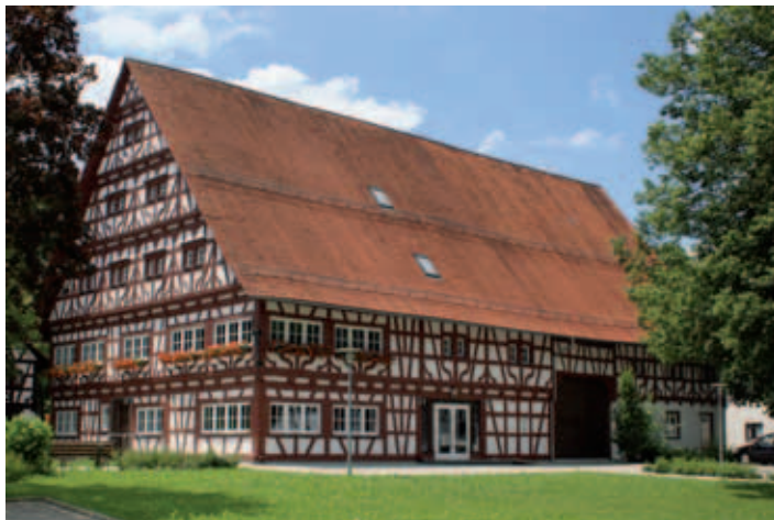
■ Rief-Haus Winterstettenstadt

1331 wurde der Besitz Winterstetten an Österreich verkauft und die Herrschaft mehrfach verpfändet. Herzog Leopold von Österreich bestätigte 1376 den Bürgern und der Stadt Winterstetten ihre Rechte und erweiterte sie durch die Blutgerichtsbarkeit und das Marktrecht. Winterstetten wurde wahrscheinlich von den Stauern zur Stadt erhoben. 1442 genehmigte König Friedrich die Versetzung der Feste und Herrschaft Winterstetten an Truchseß Georg von Waldburg um 6400 Gul-