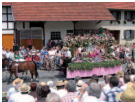
■ Blumenwagen Kreismusikfest 2008