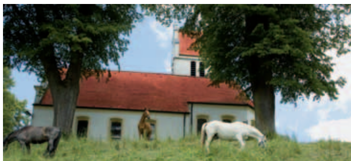
■ Laurentiuskapelle Degernau