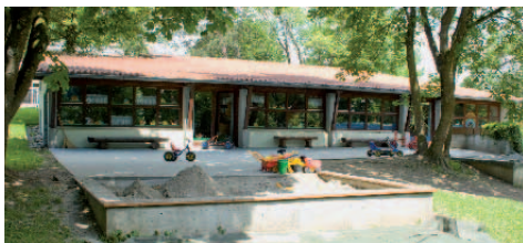
■ Kindergarten Ingoldingen