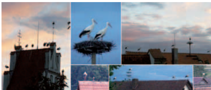
■ Störche in Ingoldingen