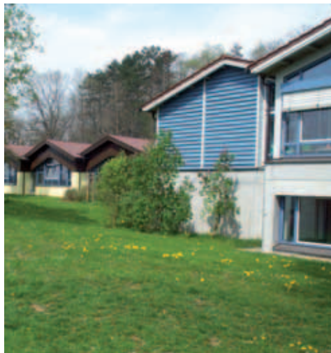
■ Grundschule Ingoldingen