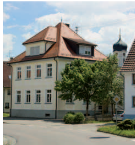
■ Grundschule Winterstettenstadt