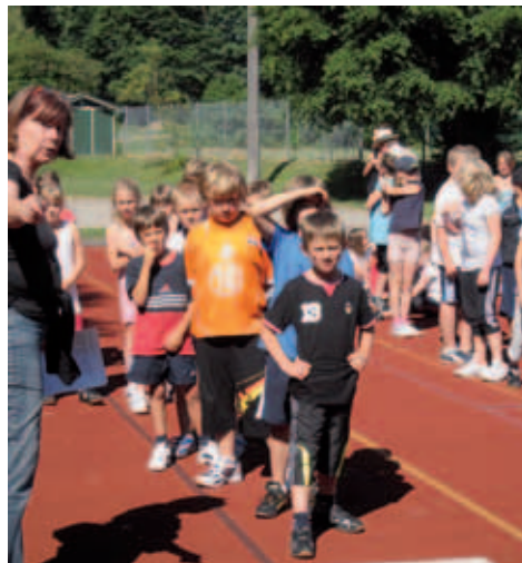
■ Bundesjugendspiele 2010