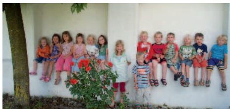
■ Im Gemeindegarten