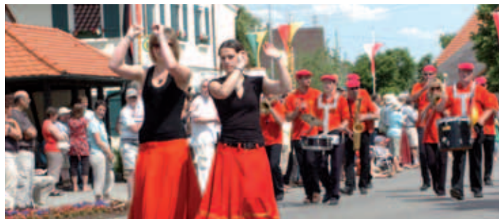
■ Französische Gruppe Kreismusikfest 2008