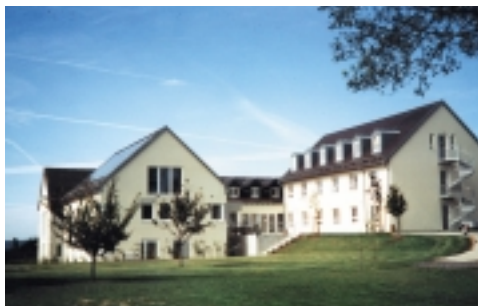
Jugendbildungshaus „Am Knock“