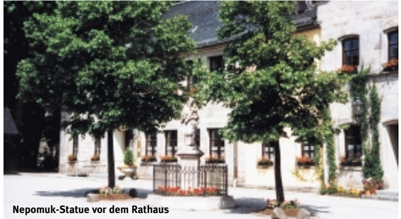
Nepomuk-Statue vor dem Rathaus

Rund um Teuschnitz laden ausgebauten Wege zum Wandern und Radfahren und im Winter zum Skilanglauf ein. Eine Herausforderung für Radsportler bieten die