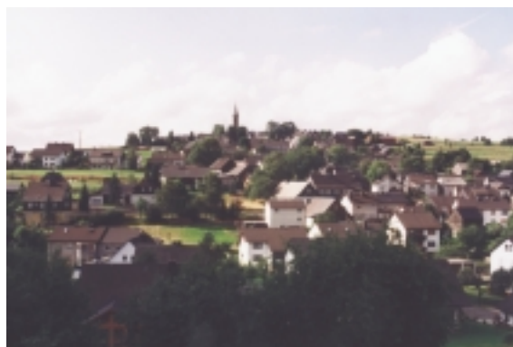
Ansicht der Gemeinde Tschirn

Internet: www.tschirn-online.de Sprechzeiten des Bürgermeisters in der Gemeindekanzlei Tschirn: Mittwoch und Samstag von 9.00 - 11.00 Uhr, zusätzlich nach Vereinbarung Verwaltung: siehe Rathaus Teuschnitz weitere Einrichtungen: siehe Teuschnitz