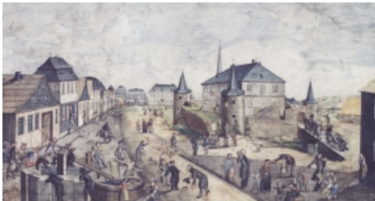
Teuschnitz vor 1844