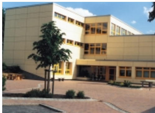
Volksschule in Teuschnitz