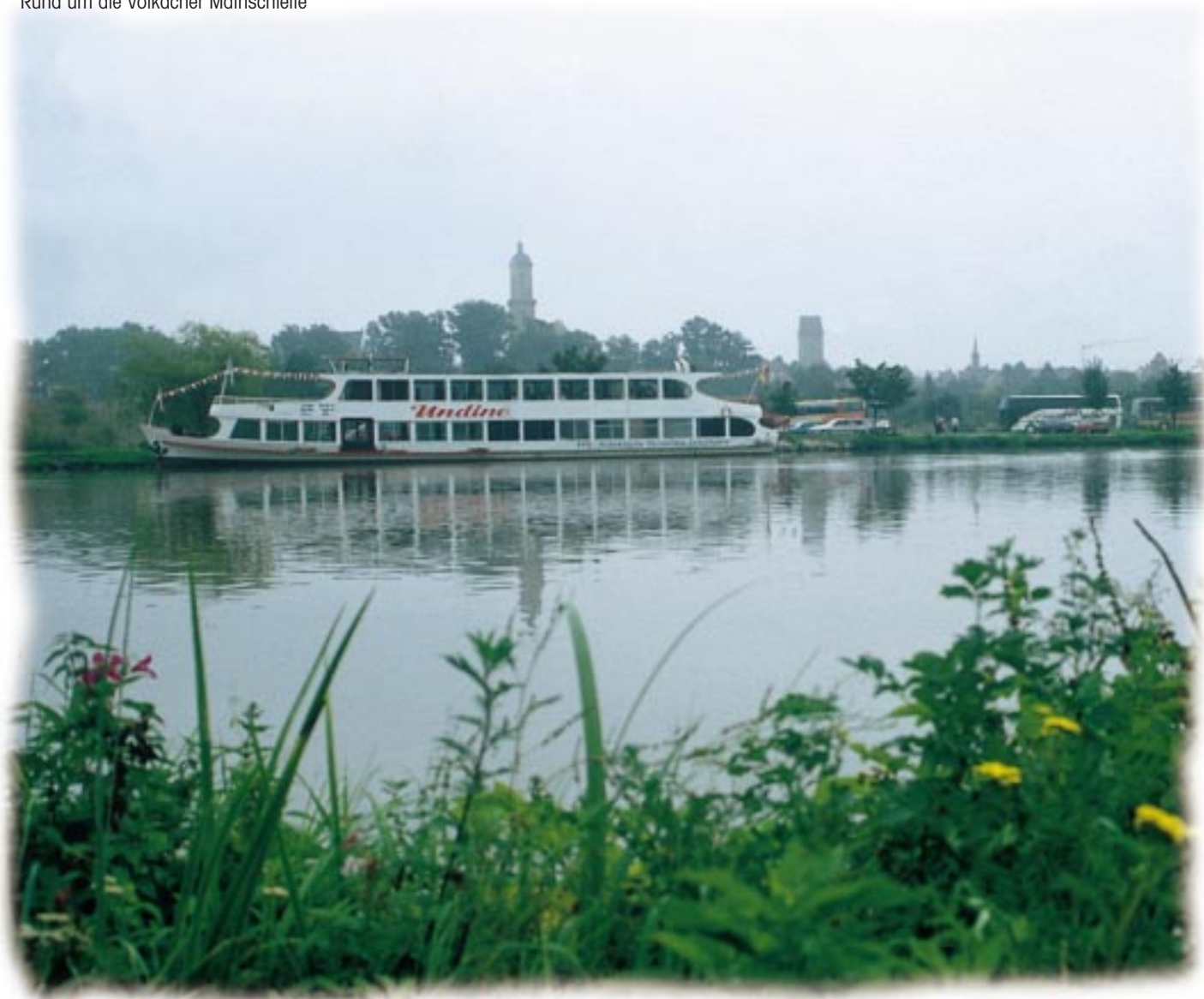
Rund um die Volkacher Mainschleife