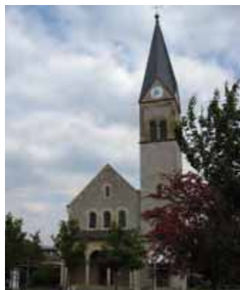
Evang. Stadtpfarrkirche (19. Jh.): Gotteshaus im neuromanischen Stil, erbaut 1898/99