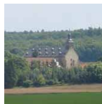
ehem.Klosterkirche Maria- burghausen (13. Jh.)