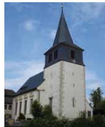
Evang. Kirche in Unterhohen- ried mit Lindenholzaltarschrein