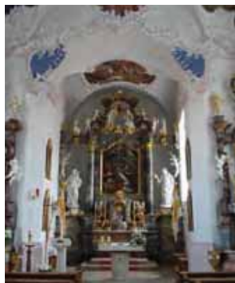
Kath. Kirche St. Maria Magdalena in Augsfeld mit Rokokoausstattung