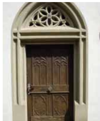
Pfote zum Hl. Geist-Kirchlein