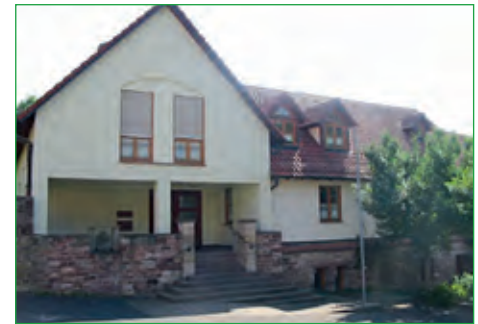
Pfarrheim Elfershausen mit Jugendzentrum