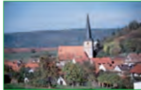
Pfarrkirche in Machtilshausen

Die katholische Pfarrkirche in Elfershausen hat einen gotischen Turm, errichtet im 14. Jahrhundert, das Langhaus wurde erst 1866 erbaut.