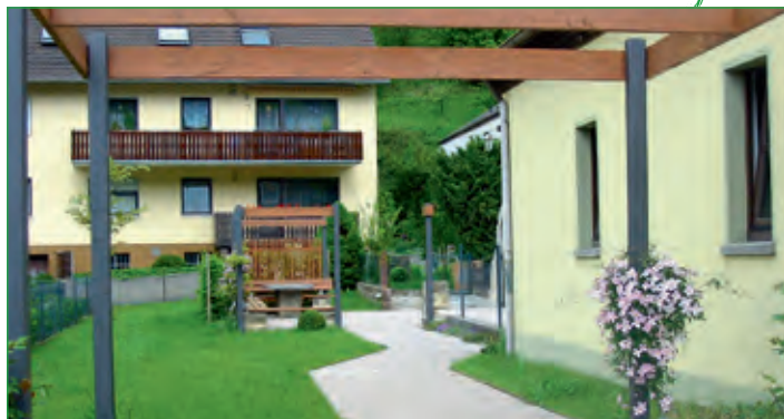
Bereich Feuerwehrhaus in Engenthal

Bayern – mit einem großen Spiel- und Bolzplatz Jung und Alt zum Verweilen einlädt.