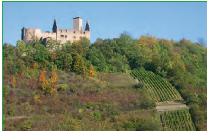
Weinberge unterhalb der Trimburg