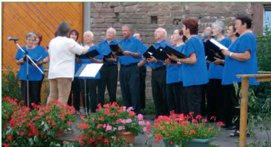
Gesangverein Harmonie Langendorf