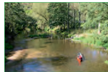
Kanufahren auf der Fränkische Saale