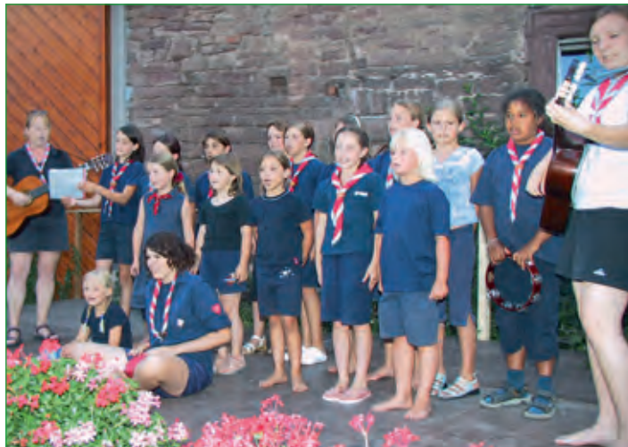
Saale-Musicum im Schlosshof Elfershausen

Die Pfarrgemeinde Machtilshausen organisiert jedes Jahr eine Fußwallfahrt nach Münnerstadt. Kirchliche Organisationen bieten unseren Senioren unterhaltsame Nachmittage.