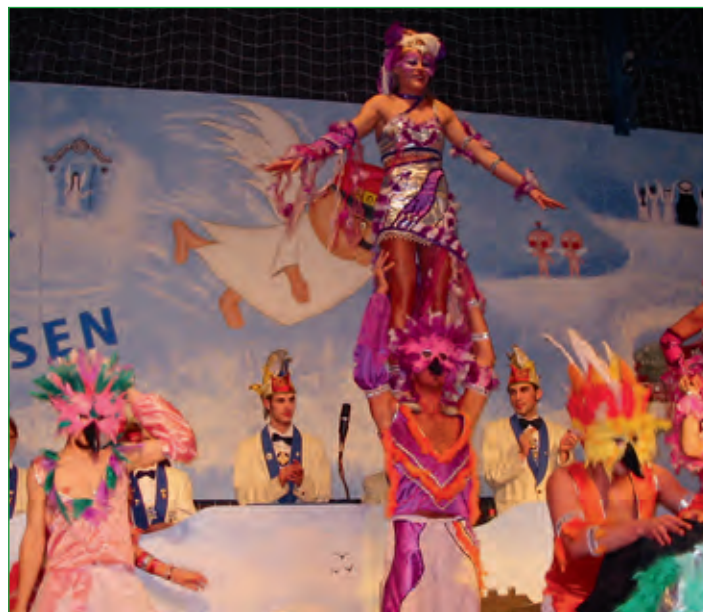
Karnevalverein Blau-Weiß Elfershausen