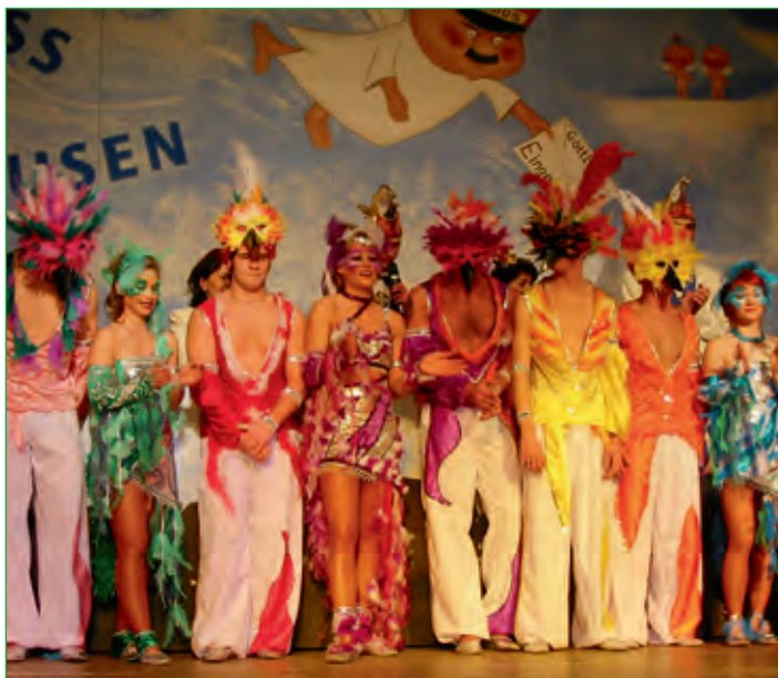
Showtanzgruppe Karnevalverein Blau-Weiß Elfershausen