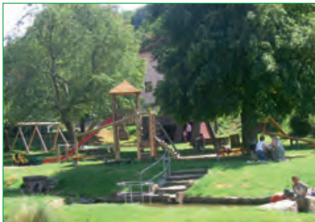
Spielplatz in Engenthal