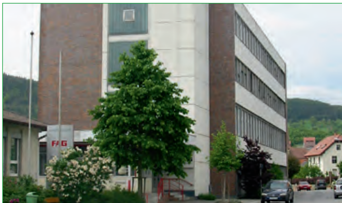
Schaeffler KG in Elfershausen