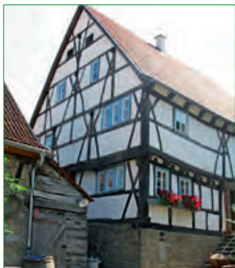
Schreinersch-Haus in Machtilshausen 2008

Als sehenswertes Baudenkmal zählt das im Jahr 1488 in spätgotischem Fachwerk erbaute „Schreinersch-Haus“ in Machtilshausen , welches durch den Verein für Gartenbau, Brauchtums- und Heimatpflege Machtilshausen wieder instandgesetzt wurde. Es ist eines der ältesten Bauernhäuser in Bayern. Sein Alter von über 500 Jahren, seine Bauausführung und sein stolzes Erscheinungsbild reihen es in eine kleine Gruppe der wichtigsten Bauerzeugnisse des Bürgertums in ganz Franken ein. Wie in einem