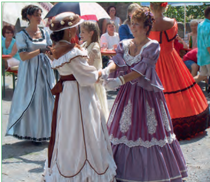
Saale-Musicum auf der Trimbung 2006