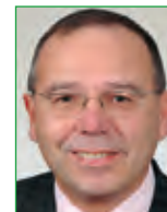
2. Bürgermeister Englert, Jürgen