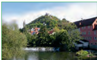
Trimberg mit Trimburg

Sehenswert in Trimberg ist die katholische Kirche St. Elisabeth aus dem 18. Jahrhundert, deren Hochaltar kunsthistorisch bedeutungsvoll ist. In der deutschen Literatur des Mittelalters tritt Trimberg mit zwei Persönlichkeiten auf. Hugo von Trimberg verfasste das umfangreiche Lehrgedicht „Der Renner“, und Süßkind von Trimberg war Minnesänger. Weitere Informationen hierzu erhalten Sie auf unserer Homepage www.elfershausen.de unter der Rubrik „Allgemeines/Geschichte“.