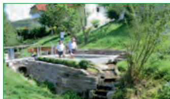
Wassertretbecken in Machtilshausen

Weitere Sportmöglichkeiten bieten der Wellnessbereich mit Sauna und Fitnessraum im Hotel Ullrich sowie die Tennisanlage am Sportgelände neben der Schwedenberghalle in Elfershausen. In Engenthal und Machtilshausen laden