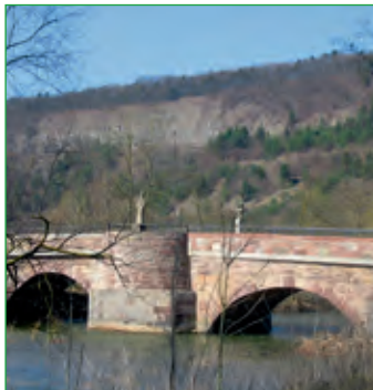
Saalebrücke Elfershausen 2008

In Langendorf verbinden Gestaltungselemente wie der Dorfbrunnen oder der Info-Pavillon „Altes mit Neuem“ in sinnvoller Symbiose.