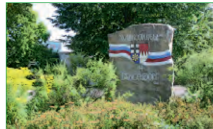
Begrüßungsstein an der Schule in Langendorf