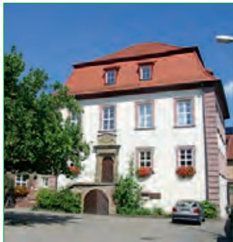
Schloss Elfershausen 2008

Das ehemalige Schloss der Herren von Erthal in Elfershausen aus dem 16. Jahrhundert dient heute als Rathaus, dem Sitz der Verwaltungsgemeinschaft mit der Gemeinde Fuchsstadt. Der zweigeschossige Barockbau hat oberhalb der Freitreppe ein schönes Portal mit dem Ehwappen Erthal-Rosenberg und eine Bauinschrift. Über die Fränkische Saale führt eine alte, aus dem 17. Jahrhundert stammende jetzt ertüchtigte Steinbrücke.