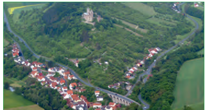
Trimberg mit Trimburg 2008