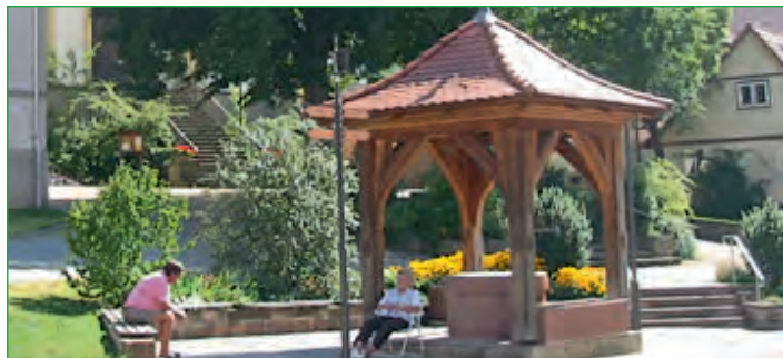
Brunnen am Dorfplatz Langendorf