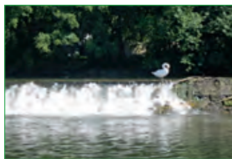
Saalewehr bei Trimberg

Im Bereich der Fränkischen Saale erfreuen sich Angeln und Kanutouren großer Beliebtheit, unterstützt durch den Bootsverleih in Trimberg.