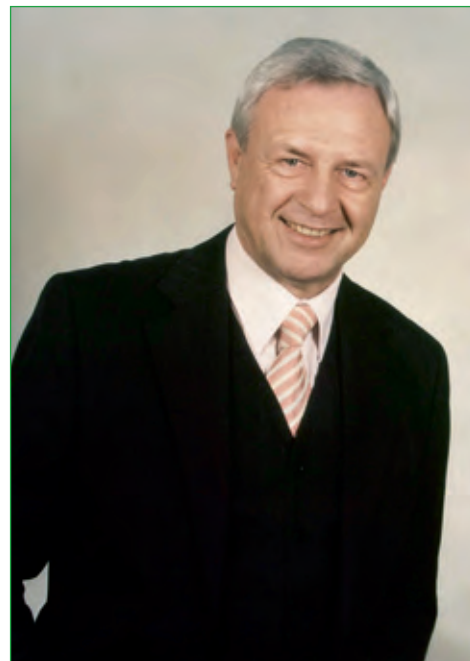
Bürgermeister Ludwig Neeb