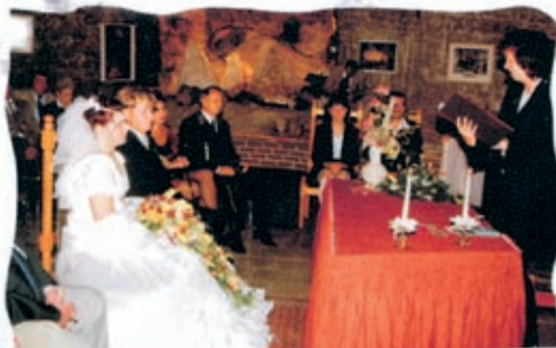
Fotostudio Apel, Sondershausen