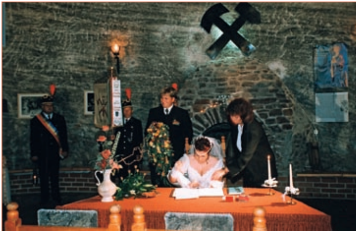
Hochzeit im Trauzimmer unter Tage (Sondershausen, am 09.09.1999)

Es gibt weder Kleidervorschriften noch Traditionen. Es ist Ihr Tag. Sie sollen sich rundherum wohlfühlen.