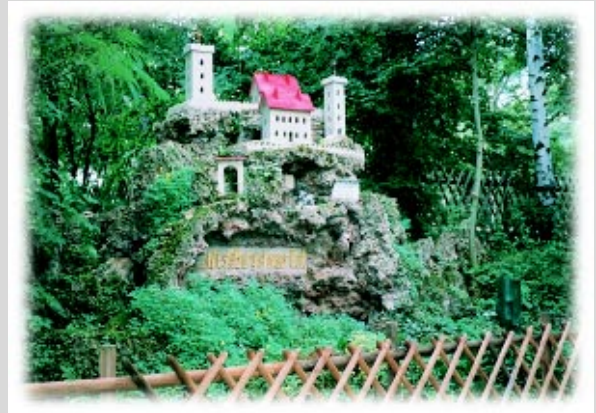
Eingang Naherholungszentrum „Kleine Wartburg“ Clingen

mildes Klima, dadurch Weinanbau im Mittelalter möglich