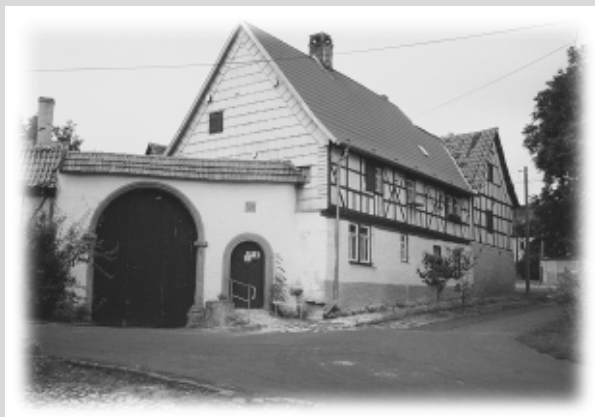
Altes Fachwerkhaus in Trebra

Zwischen den Kirchengemeinden Trebra und Zell in Schwaben bestehen Partnerbeziehungen.