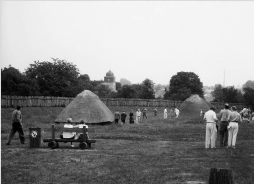
Archäologisches Freilicht- museum „Frankenburg“ Westgreußen