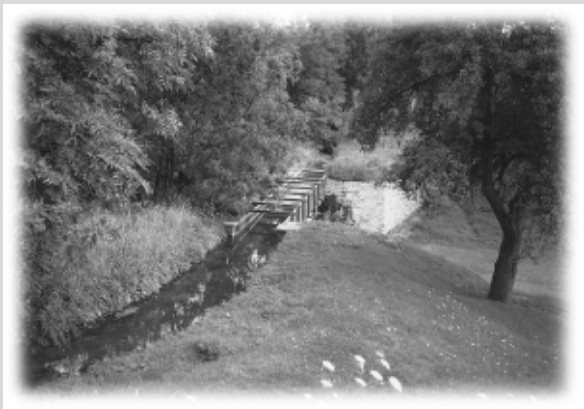
Aquadukt (Gerinne Westgreußen)

Westgreußen, mit 483 Einwohnern, hat eine Gesamtfläche von 845 ha und ist über die Straße LIO 41, 3 km westlich der B 4, Greußen - Ebeleben zu erreichen. Am nordwestlichen Gemarkungsende Richtung Wasserthaleben befindet sich die Helbe-Wehranlage mit den daneben liegenden Grundslöchern, welche für die Trinkwasser-Gruppenversorgung Greußen verantwortlich zeichnen.