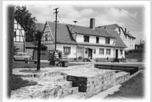
die „Schelle“ in Trebra

Mit seinen gewundenen Straßen und platzartigen Erweiterungen, den Abschluß der Grundstücke mit mannshohen Natursteinmauern, den Satteldächern mit roter Ziegeleindeckung fügt sich Trebra in die Landschaft ein. Von der Klosterhofanlage zeugt heute noch eine alte Scheune, in der Secco-Malerei auf Lehm und Darstellungen biblischer Motive vorhanden sind. Die Kirche St. Petri zählt ebenfalls zu den Sehenswürdigkeiten.