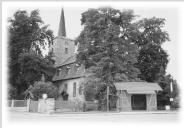
Kirche in Niedertopfstedt

Seit dem 01.01.1993 bildet Topfstedt gemeinsam mit den Orten Greußen (Kerngemeinde), Clingen, Westgreußen, Wasserthaleben die Verwaltungsgemeinschaft Greußen (inzwischen um die Gemeinde Trebra und Niederbösa erweitert). Geographisch gehört Topfstedt zur Thüringer Hügellandschaft und liegt im Thüringer Becken. Gemeinsam mit den Orten der Verwaltungsgemeinschaft zählt Topfstedt zu den niederschlagsärmsten Gebieten der gesamten BRD.