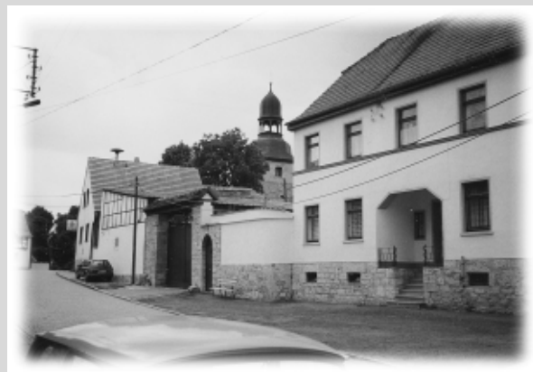
Dorfstr. 3 und „Kirche“ Niederbösa