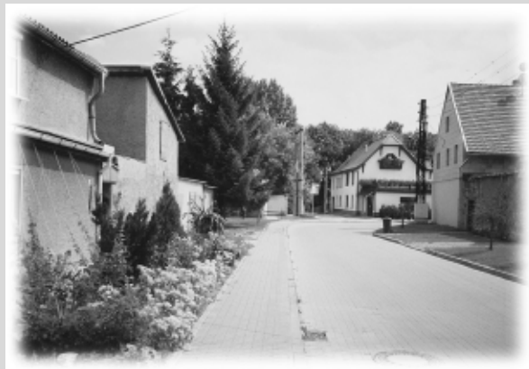
Straße des Aufbaus Westgreußen