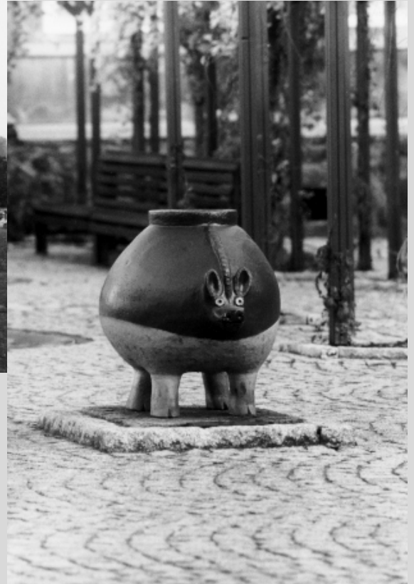
Greußener Eber Kult- und Fruchtbarkeitsfigur ca. 200 n. Chr.