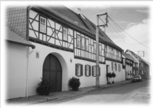
Brunnenstraße in Clingen