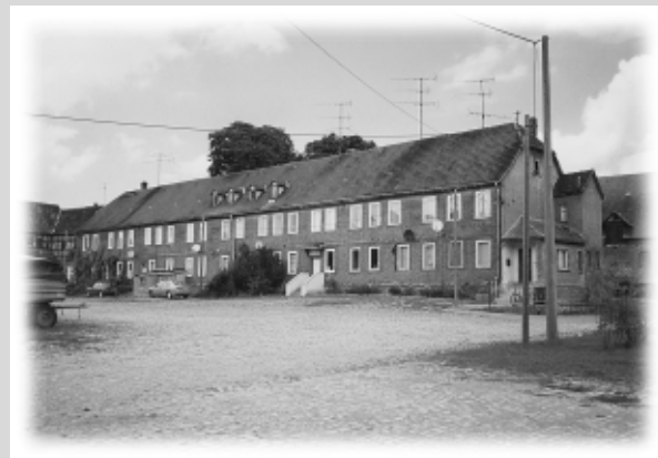
Das „Gut“ in Wasserthaleben