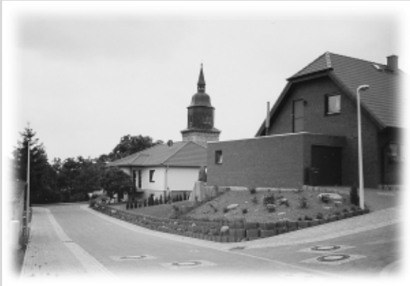
Wohngebiet „Am Hohlweg“ Obertopfstedt

Der Ort war von 1995 -97 ein Förderschwerpunkt im Dorferneuerungsprogramm des Landes Thüringen, um die Harmonie von Landschaft und Siedlung, die Überschaubarkeit des Lebensraumes und die Angemessenheit der Bauformen auch für folgende Generationen erhalten und zu bewahren zu können. Dies mag eine Ursache dafür sein, daß aus der Entwicklung der Gesamteinwohnerzahl und der natürlichen Bevölkerungsentwicklung der allgemeine Trend zur Abwanderung aus dörflichen Siedlungsgebieten noch nicht augenfällig ist und sich in diesem Zeitraum die Einwohnerzahl von 630 auf 680 erhöhte.