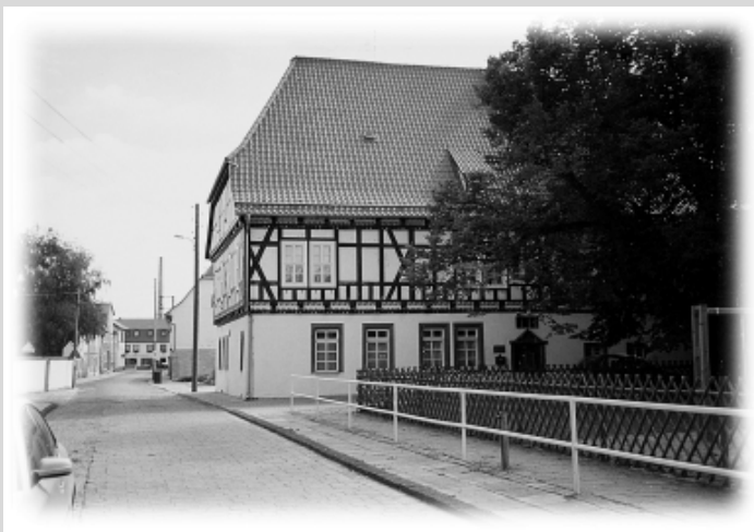
„Domäne“ in Clingen

Maßnahmen im privaten Bereich sollen dafür sorgen, das für Clingen Ortstypische, wieder verstärkt zur Geltung zu bringen.