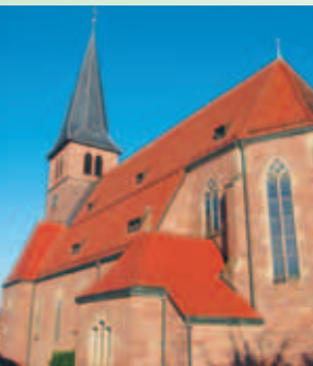
Die Pfarrkirche St. Anna

Zahlen – Daten – Fakten können Sie beim Statistischen Landesamt Baden-Württemberg kostenlos unter www.statistik-bw.de herunterladen. Verwenden Sie hierzu den dortigen Link „Regionaldaten“.