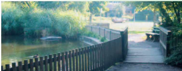
Ein lauer Sommermorgen am Entensee bei der Grundschule