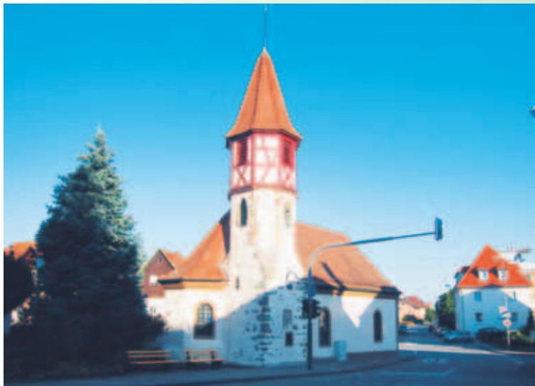
Die St. Annen Kapelle in morgendlichem Glanz