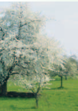
Bis: die Kirschblüte