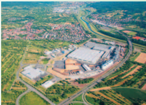
Bischweier aus der Vogelperspektive

Unternehmen wie der Dambach Lagersysteme GmbH oder der Kronospan GmbH mit teilweise über 100 Mitarbeitern.