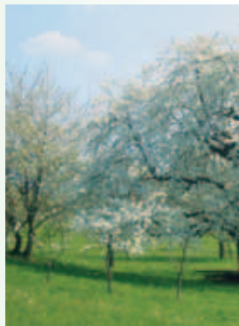
Herrlich im Frühling