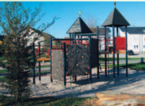
Zum Austoben: Spielplatz Winkelfeld